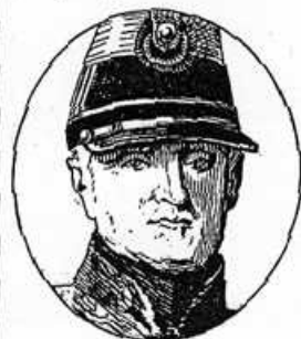
Fig. 25. — LE MARÉCHAL BUGEAUD.

1. Bugeaud a été un grand colonisateur. — En même temps qu'il menait la lutte contre Abd-el-Kader, Bugeaud donnait tous ses soins à la colonisation. On connaît sa devise : Ense et aratro (par l'épée et par la charrue).