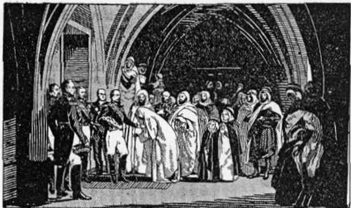
Fig. 22. — LE PRINCE NAPOLEON REND LA LIBERTÉ A ABD-EL-KADER, 1852.

(Tableau d'H. Vernet au Musée de Versailles.)