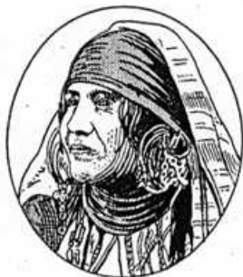
Fig. 27. — BÉDOUINE.

— Après la révolution de 1848, embarrassé des ouvriers qui se trouvaient sans travail à Paris, le Gouvernement projeta d'en établir un certain nombre en Algérie. L'Assemblée nationale vota 50 millions destinés à la création de 42 colonies agricoles.