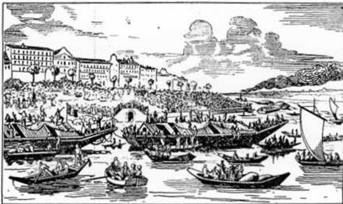
Fig. 28. — PREMIER DÉPART DES COLONS PARISIENS, LE 8 octobre 1848. Extrait de l'Illustration (1848).