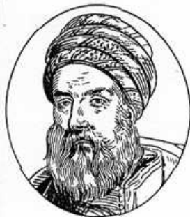
Fig. — 19. LE DEY HUSSEIN.

1. Les causes de l'expédition de 1830 furent purement accidentelles. — Deux Juifs algériens avaient fourni à la