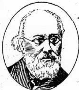
Fig. 23. — D r MAILLOT.

1. La colonisation rencontre à ses débuts de grands obstacles. — En 1830, le paludisme sévissait dans les plaines, dans les vallées incultes, et pour mettre en valeur ces régions aujourd'hui si fertiles, des générations de colons ont succombé à la tâche. Dès 1834 cependant, un médecin militaire, le D r Maillot, préconise contre le paludisme l'emploi de la quinine et peu à peu la mortalité diminuera.