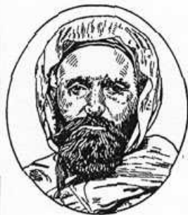
Fig. 21. — ABD-EL-KADER.

1. Le système de « l'occupation restreinte » l'emporta de 1830 à 1840. — Des instructions données en 1837 le définissent ainsi :