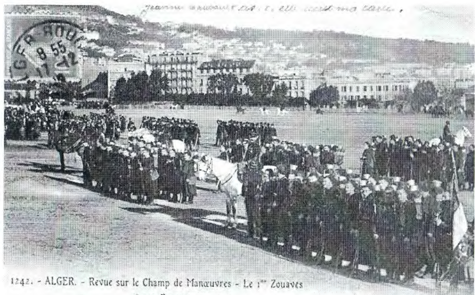
1242. - ALGER. - Revue sur le Champ de Manœuvres - Le 1 er Zouavés et son Drapeau