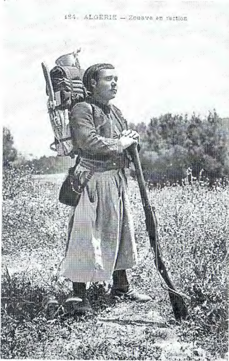
194. ALGERIE — Zouave en action