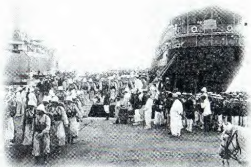
Alger - (1901) Refus de l'Empire de l'Algérie de servir les Zouaves - Le départ