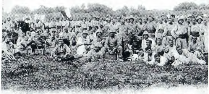
1307. TAZA — Compagnie du 3 e bataillon du 2 e zouave, sous les murs de TAZA