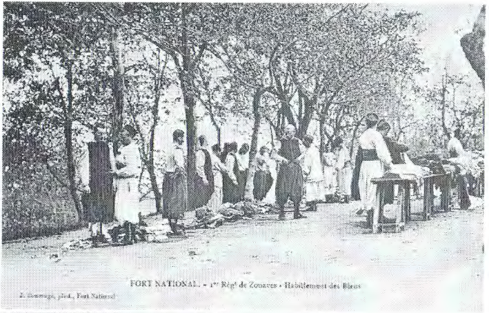
FORT NATIONAL. - 1 er Rég de Zouaves • Habilement des Béras