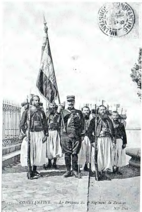
CONSTANTINE. — Le Drapeau du Régiment de Zouaves.