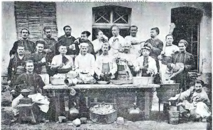
222 LALLA MAGHERIA - Les Escouades du 2 me Zouave L. 4