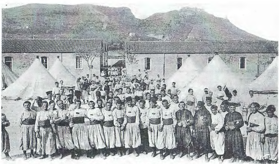
453 ORAN. — Vue d'ensemble du Camp Saint-Philippe et Djebel-Mourdjadjo.