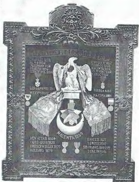
ALGERIE. — Histoire et le Drapeau de Zouaves.