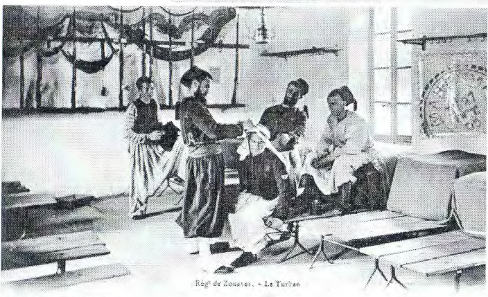
Rég de Zouaves. - Le Turban