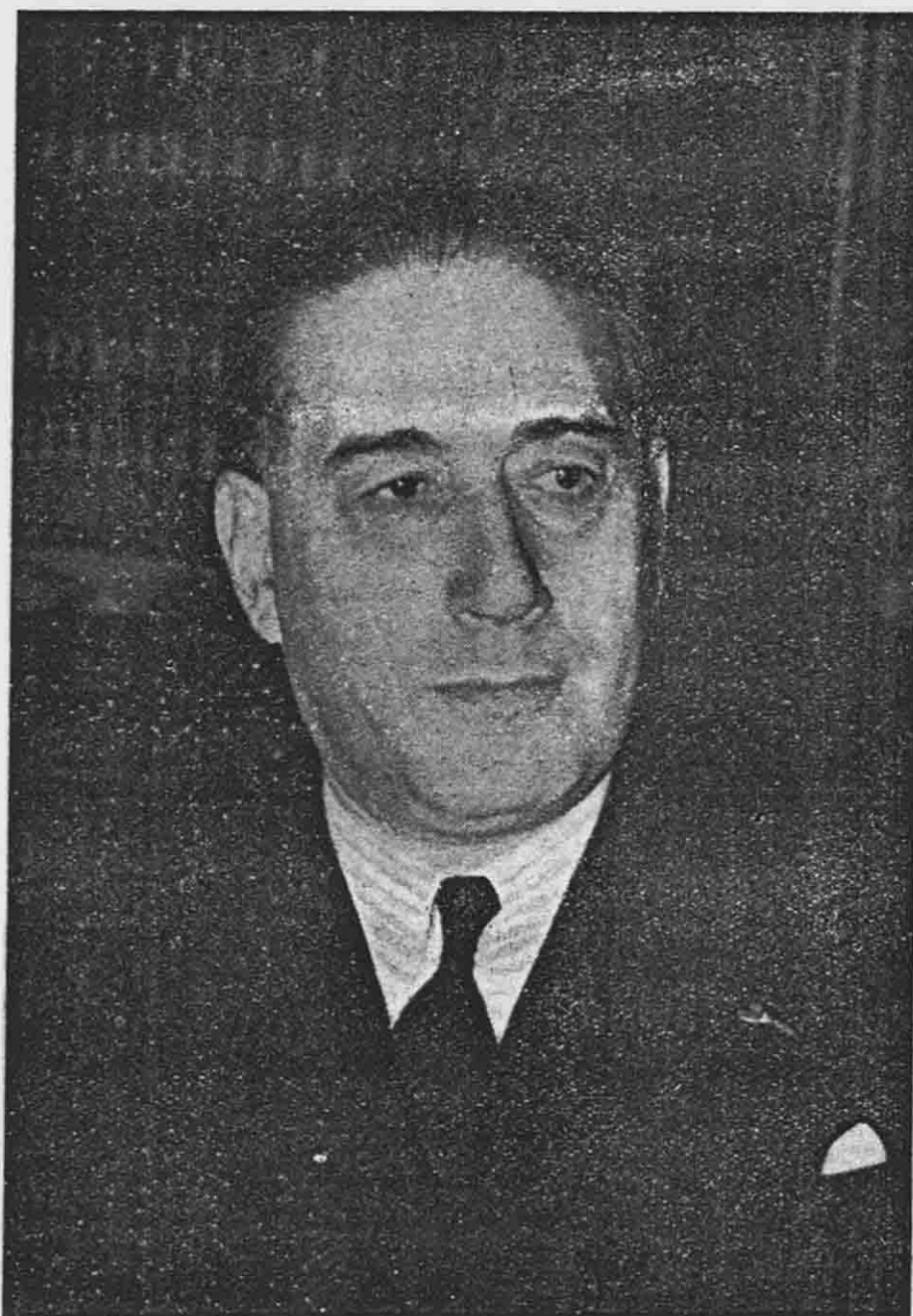
M. René MAYER Président du Conseil des Ministres Député de Constantine