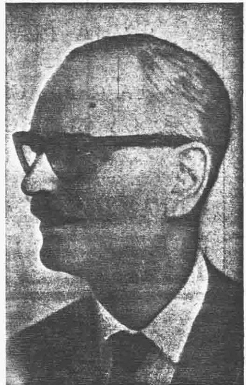
Paul DEVINAT Secrétaire d'Etat aux Travaux publics et à l'Aviation civile