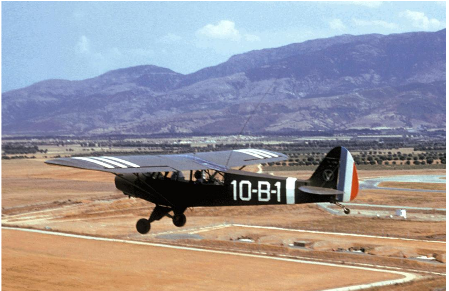
Blida décollage en piste 07 du Piper L-18C, codé 10-B-1, pour réservistes ALAT et CAPM 14.