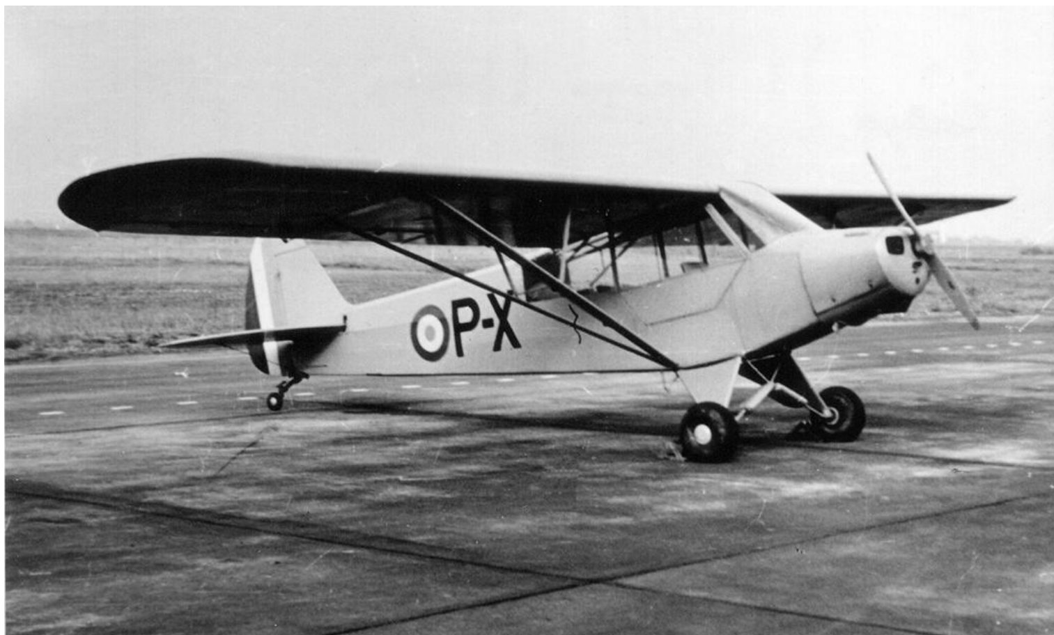
L-18C, codé P-X su GAOA N°2.