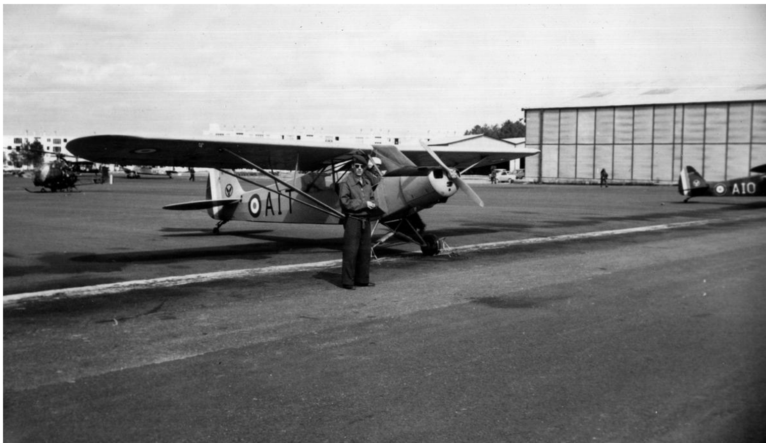
L-18C, codé AIT, de l'ES.ALAT, à Dax, stage 6P-59..