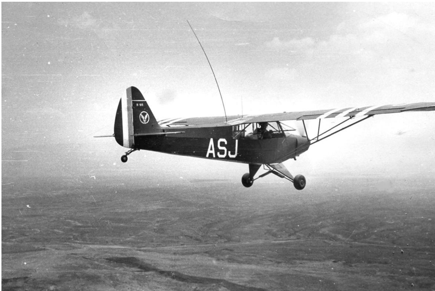
L-18C du 2 e PA de la 19 e DI, à M'Sila, au défilé du 14 Juillet 1959.