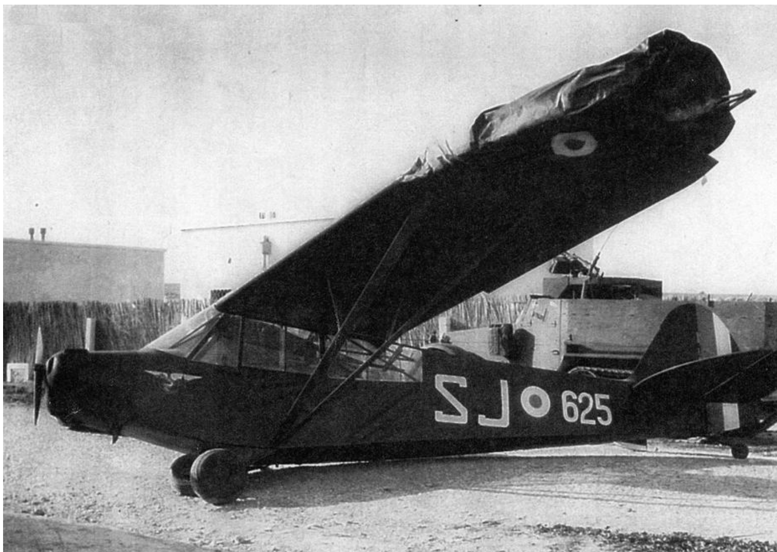
L-18C n°18-1625/SJ, accidenté à Kasserine, le 18 février 1957, équipage Granet et Mares.