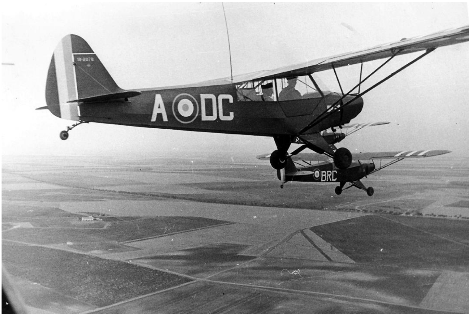
Sidi-bel-Abbès en 1960, Piper L-18C n°18-2078/ADC du 2 e PMAH de la 13 e DI.