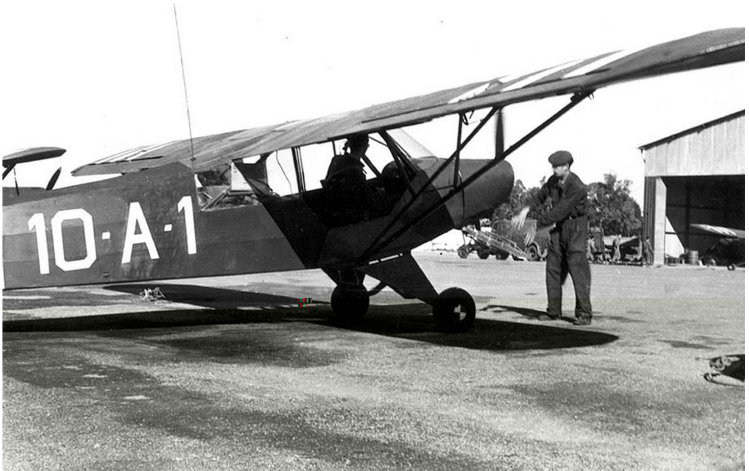
Piper L-18C, mis à la disposition de l'aéro-club d'Alger.