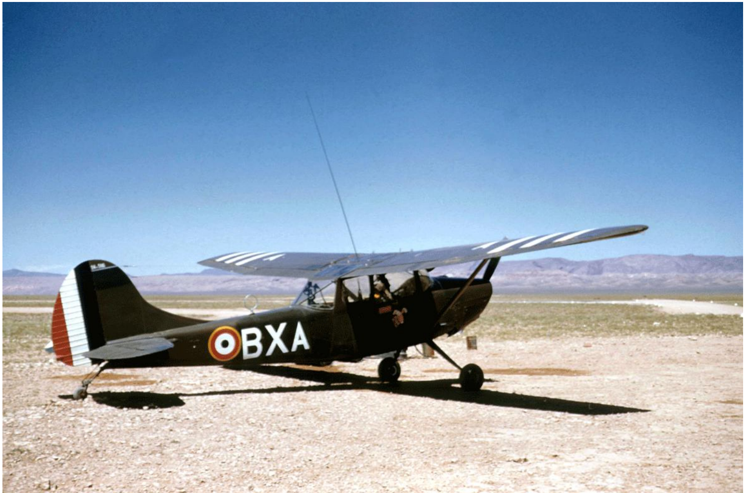
Cessna L-19E n° 24506/BXA du 1 er PA ZOS, l'insigne du peloton est peint sur la porte.