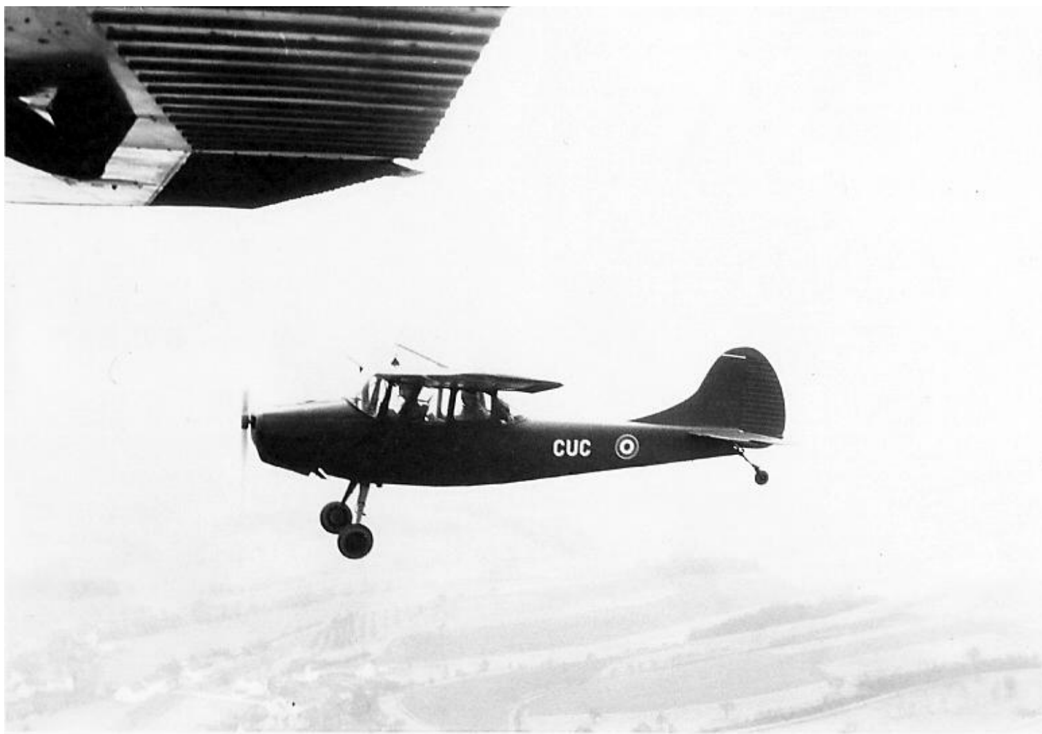
L-19E, codé CUC, de l'escadrille avions du Galdiv 1, le 17 février 1967.