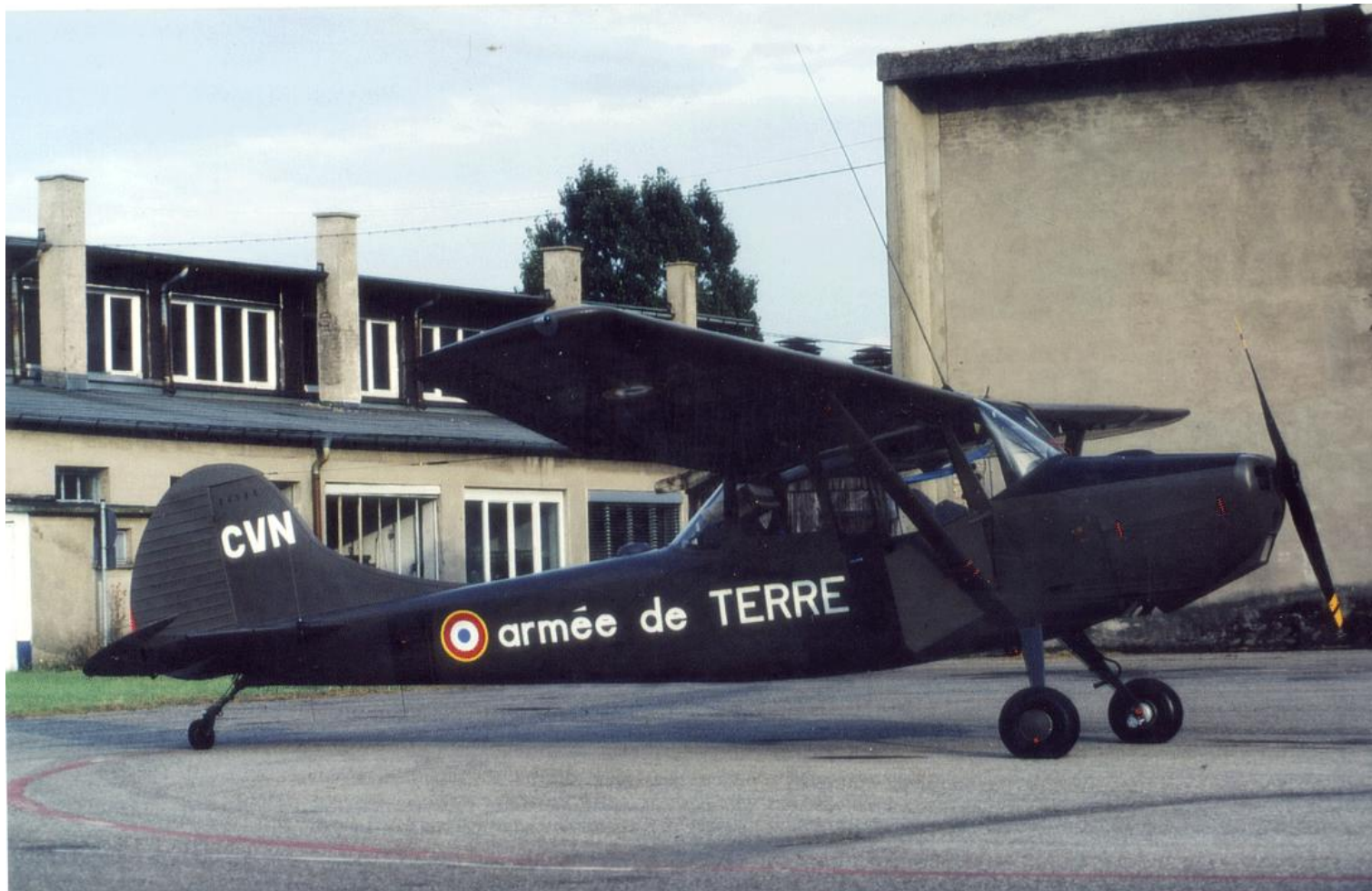
L-19E n° 24585/CVN de l'EL 1 re Armée, à Baden, en octobre 1987.