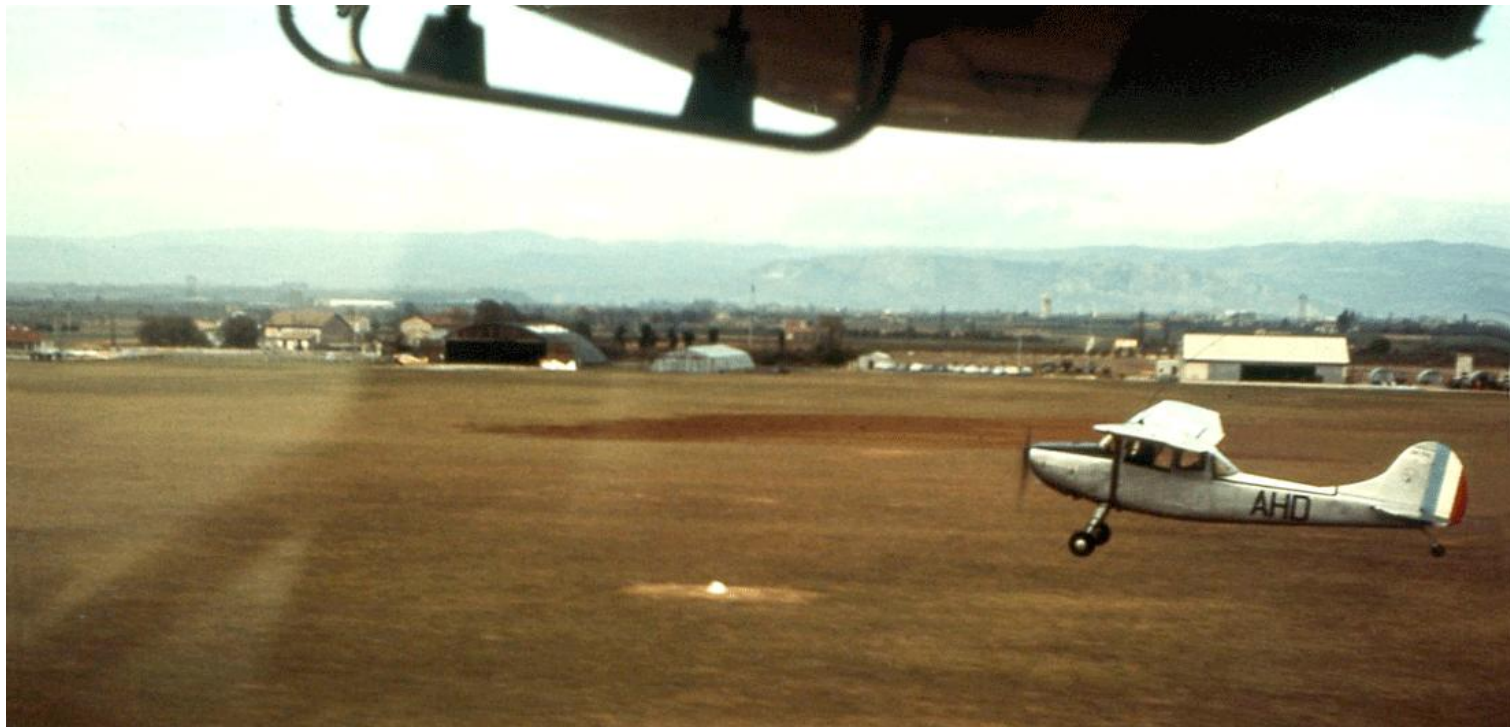
Cessna L-19E survolant les installations du 8 e GALAT, à Valence en 1964.