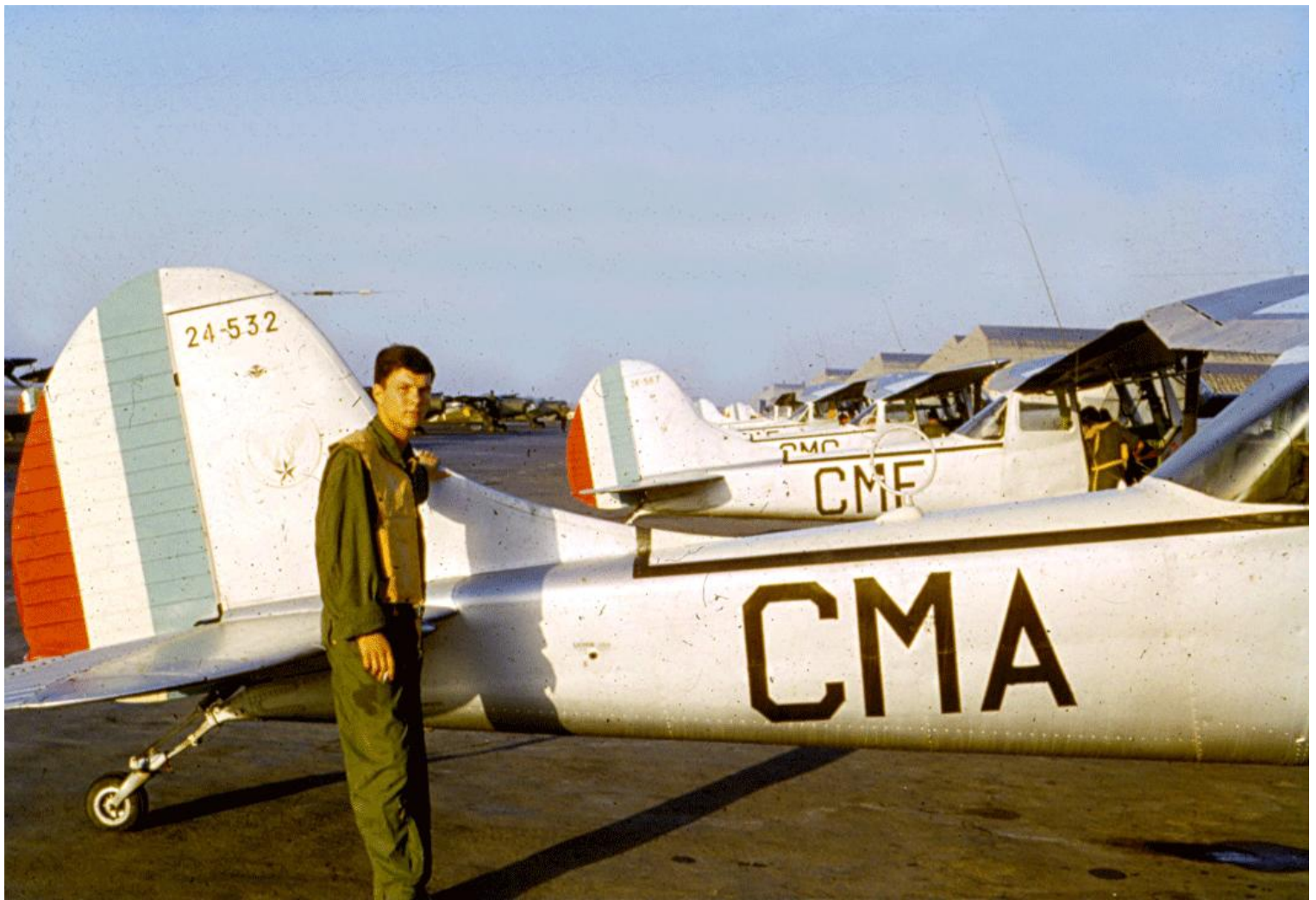
8 septembre 1962, les L-19E du GALAT N°3 à Oran avant leur départ pour Alicante. Au premier plan, le L-19E n° 24532/CMA.