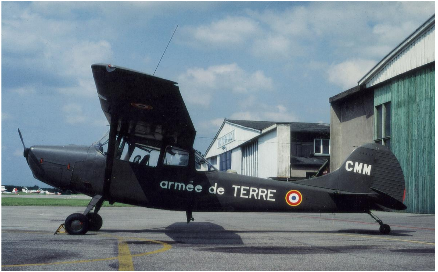
L-19E n° 24548/CMM de l'EL 1 ère Armée, en juin 1983, à Baden.