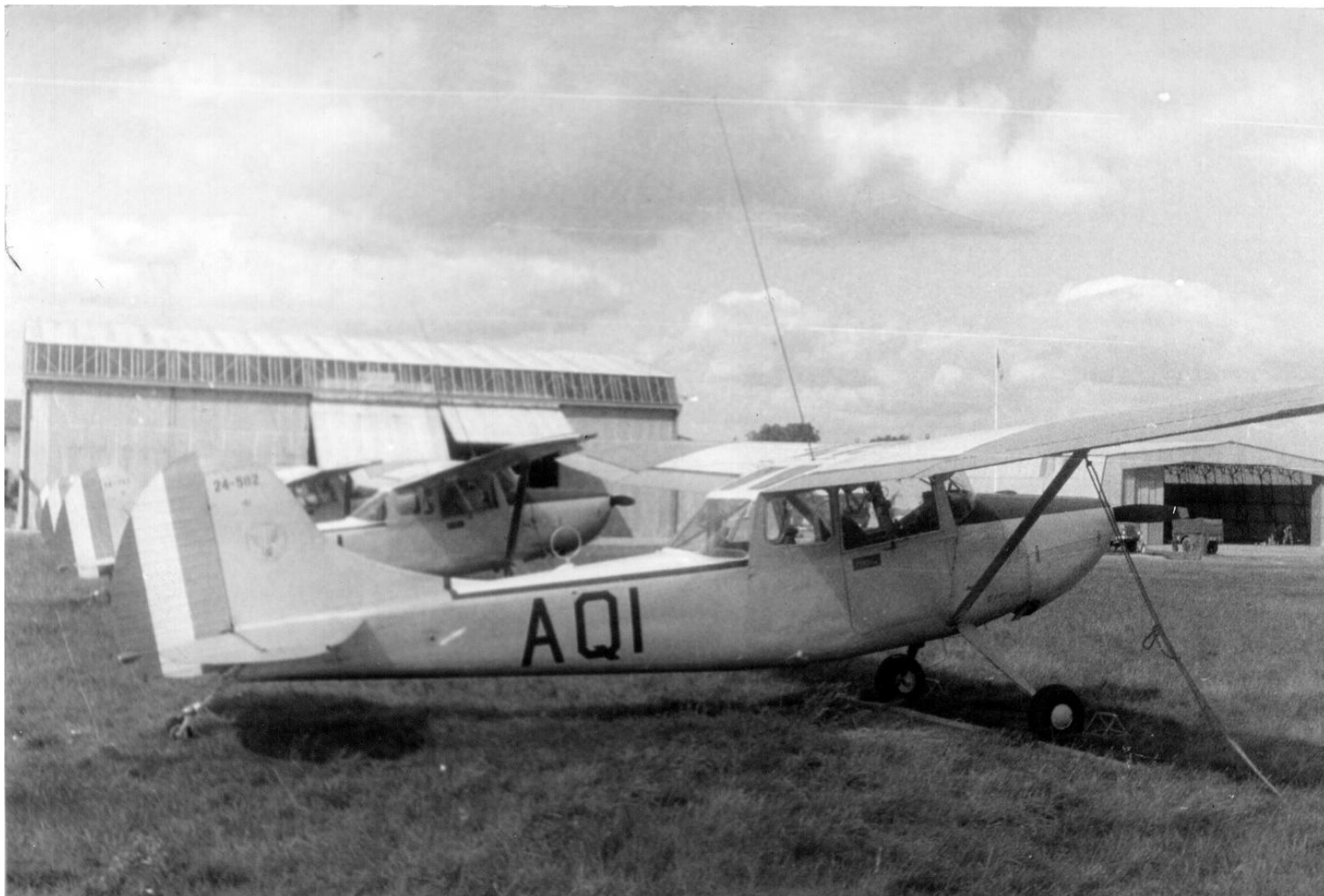
Cessna L-19E n° 24582/AQI du 5 e GALAT en septembre 1963 à Tarbes.