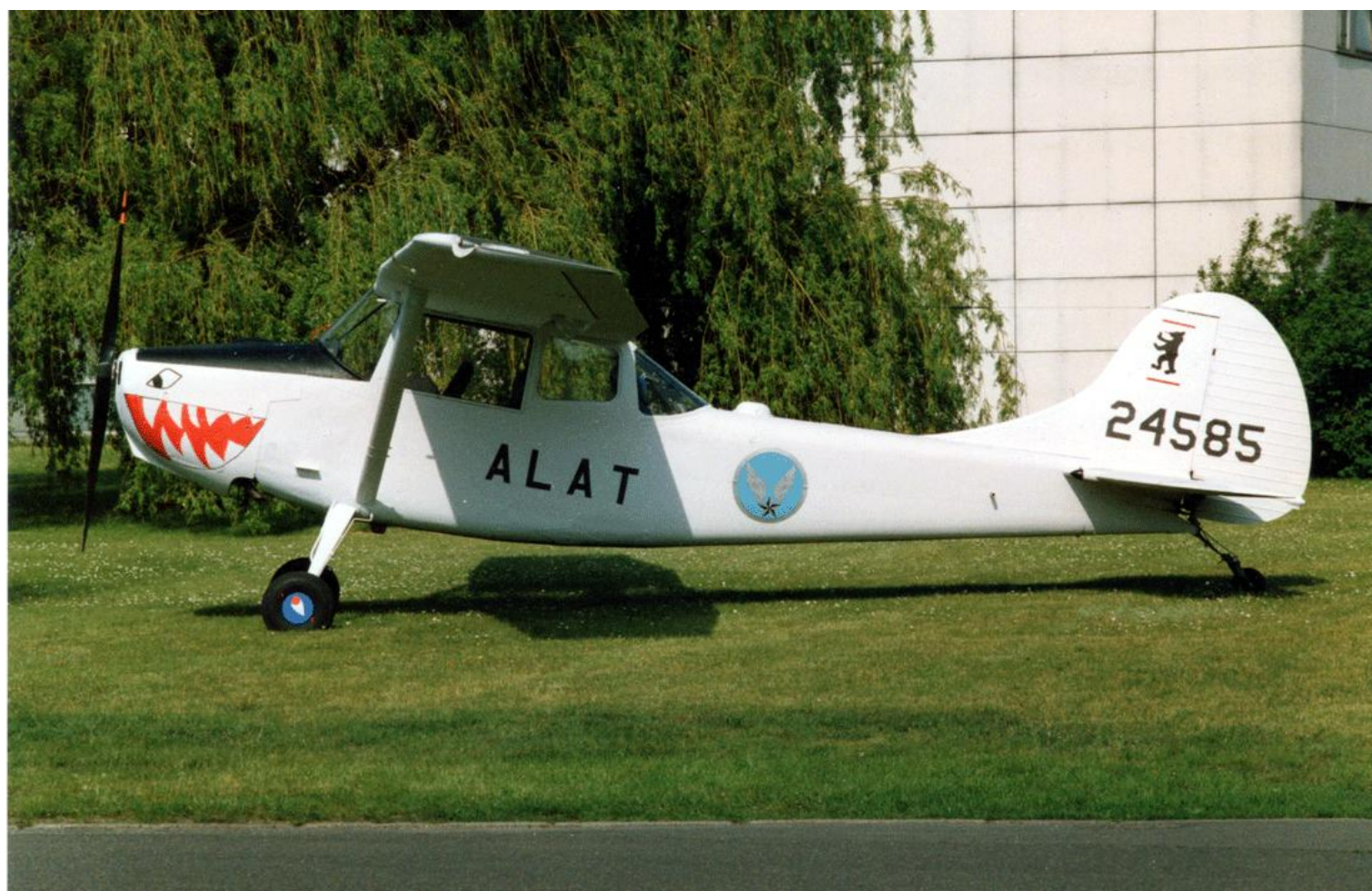
L-19E n° 24585, du Detalat de Berlin, en 1991 à Berlin Tegel. Seul ce côté a été peint en attendant l'accord du chef du détachement qui ne donna pas son autorisation de continuer.