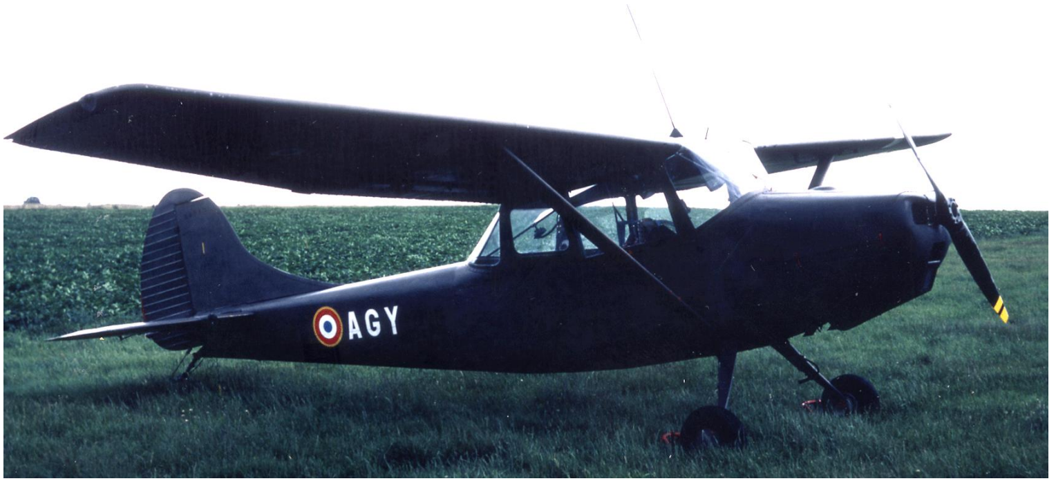
L-19E n° 24712/AGY, du 3 e GHL, le 2 juin 1980 à Saint Malo.