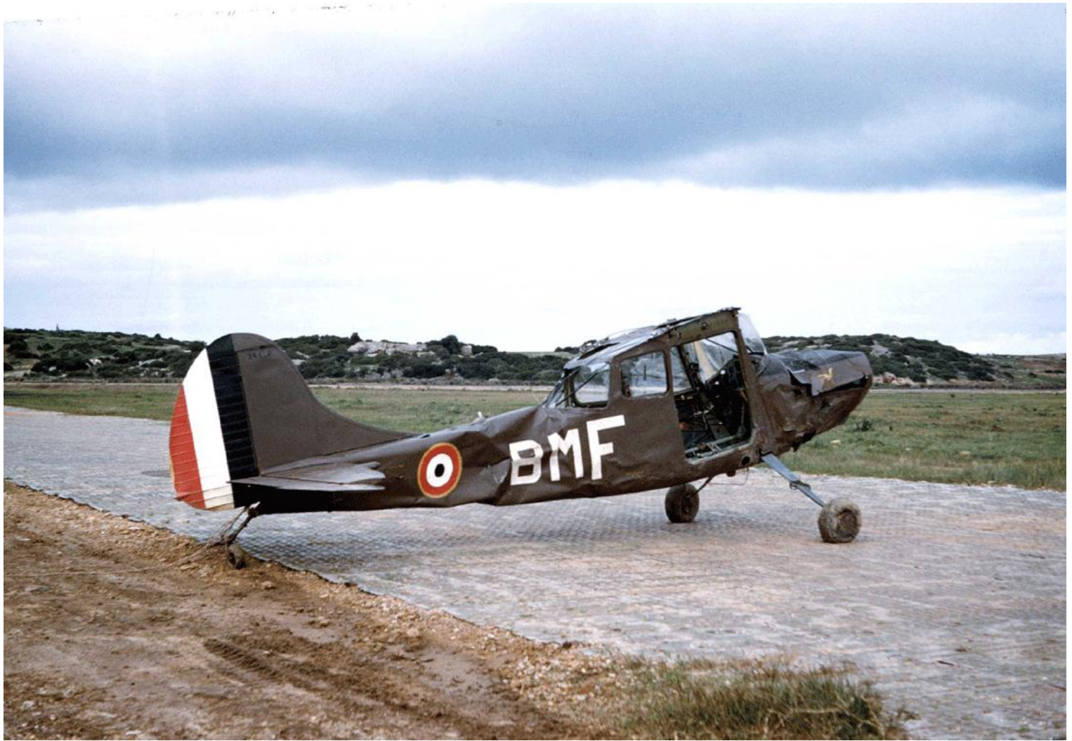
L-19E n° 24522/BMF, du PMAH de la 14 e DI, accidenté le 19 décembre 1958. Réformé, l'appareil sera reconstruit en 1964.