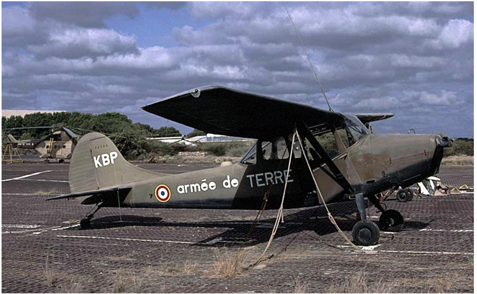
Cessna L-19E n° 24566/KBP du Délatat de Djibouti en mars 1984.