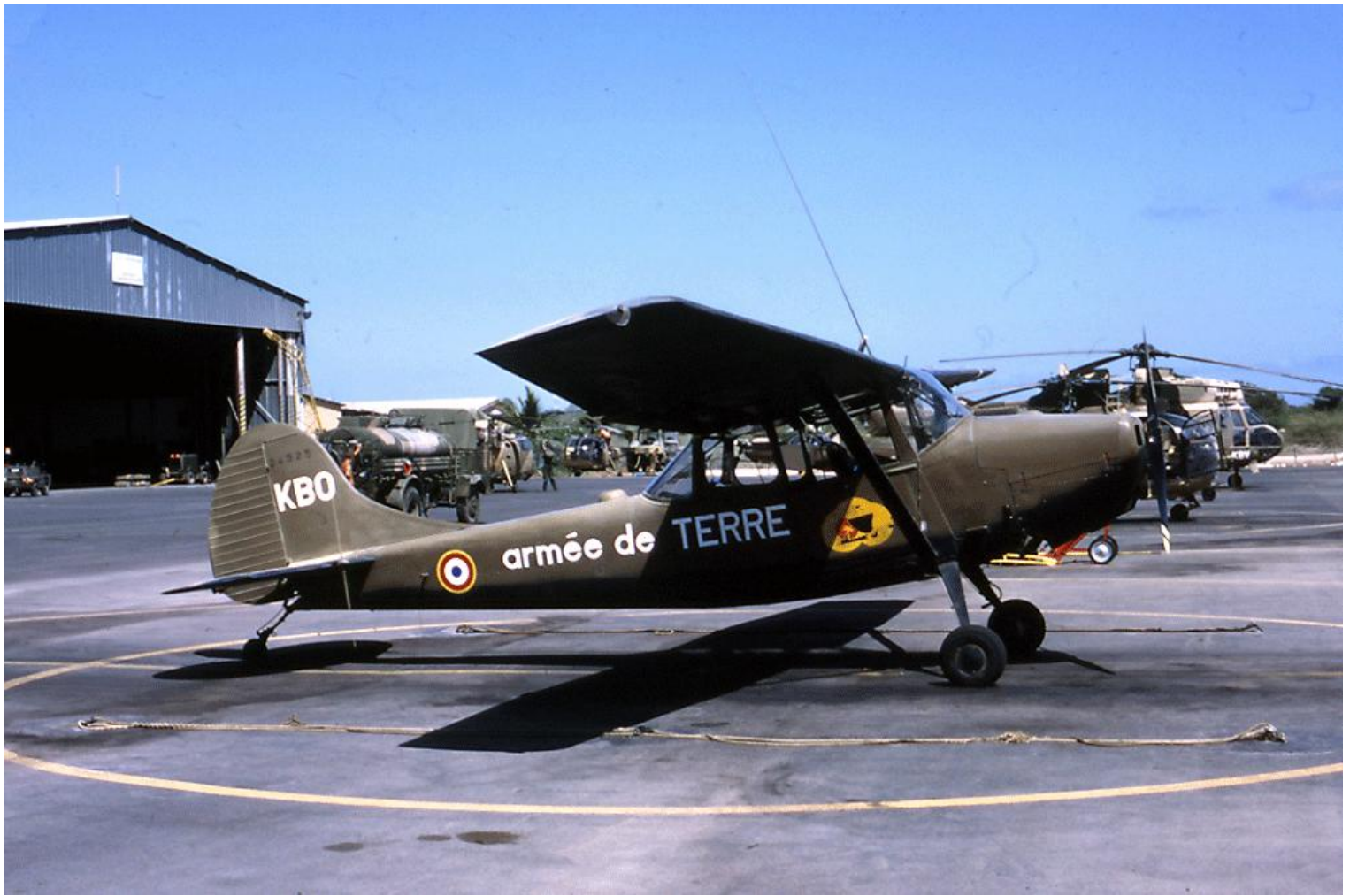
L-19E n° 24525/KBO du Detalat Djibouti, en mars 1984 à Djibouti. Il porte l'insigne de l'ETOM 88.