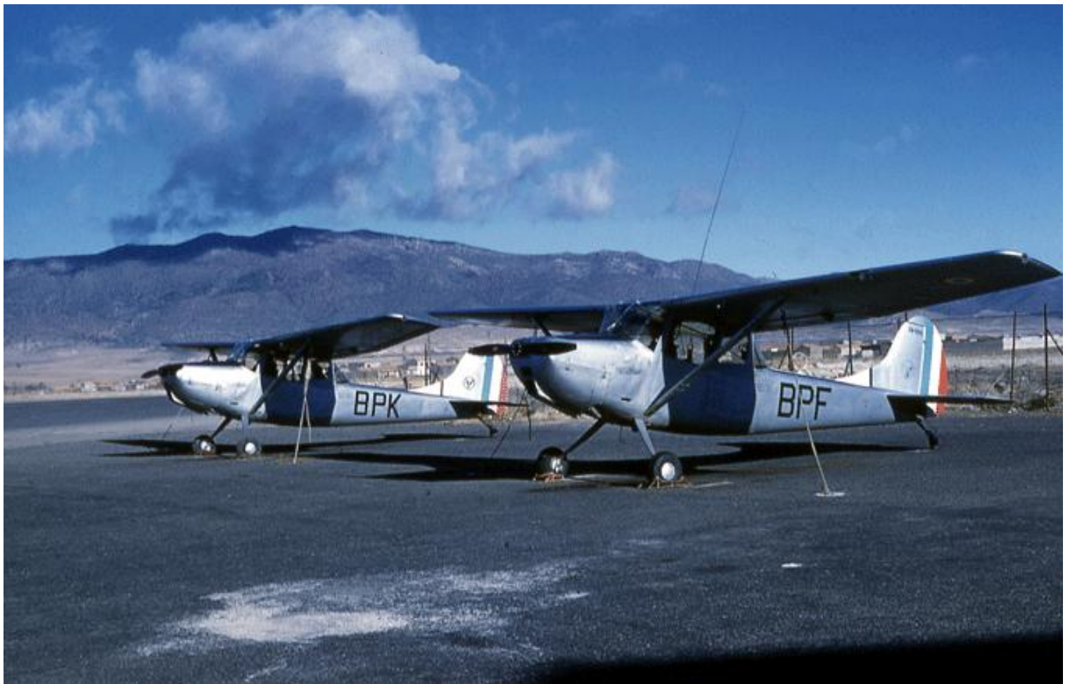
Batna, décembre 1960, L-19E n° 24548/BPF et 24568/BPK du PMAH de la 25 e DP