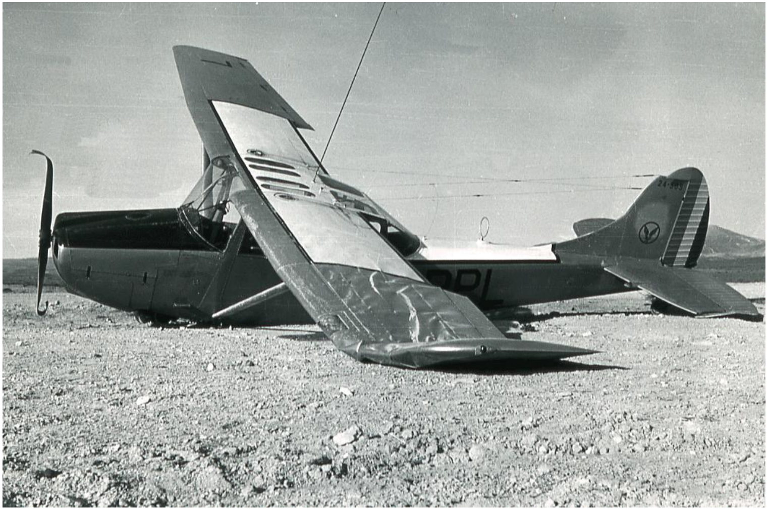
Accident le 8 février 1961 à Taberdga avec le L-19E n° 24505/BPL du PMAH de la 25 e DP.