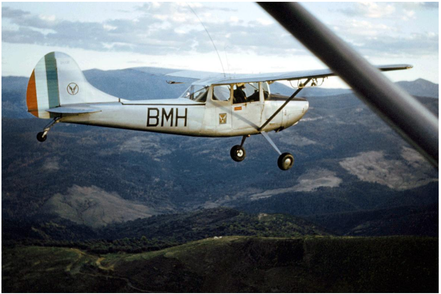
Djidjelli en 1961, L-19E n° 24730/BMH du PMAH de la 14 e DI. A noter, l'insigne de la division à l'arrière de la portière.