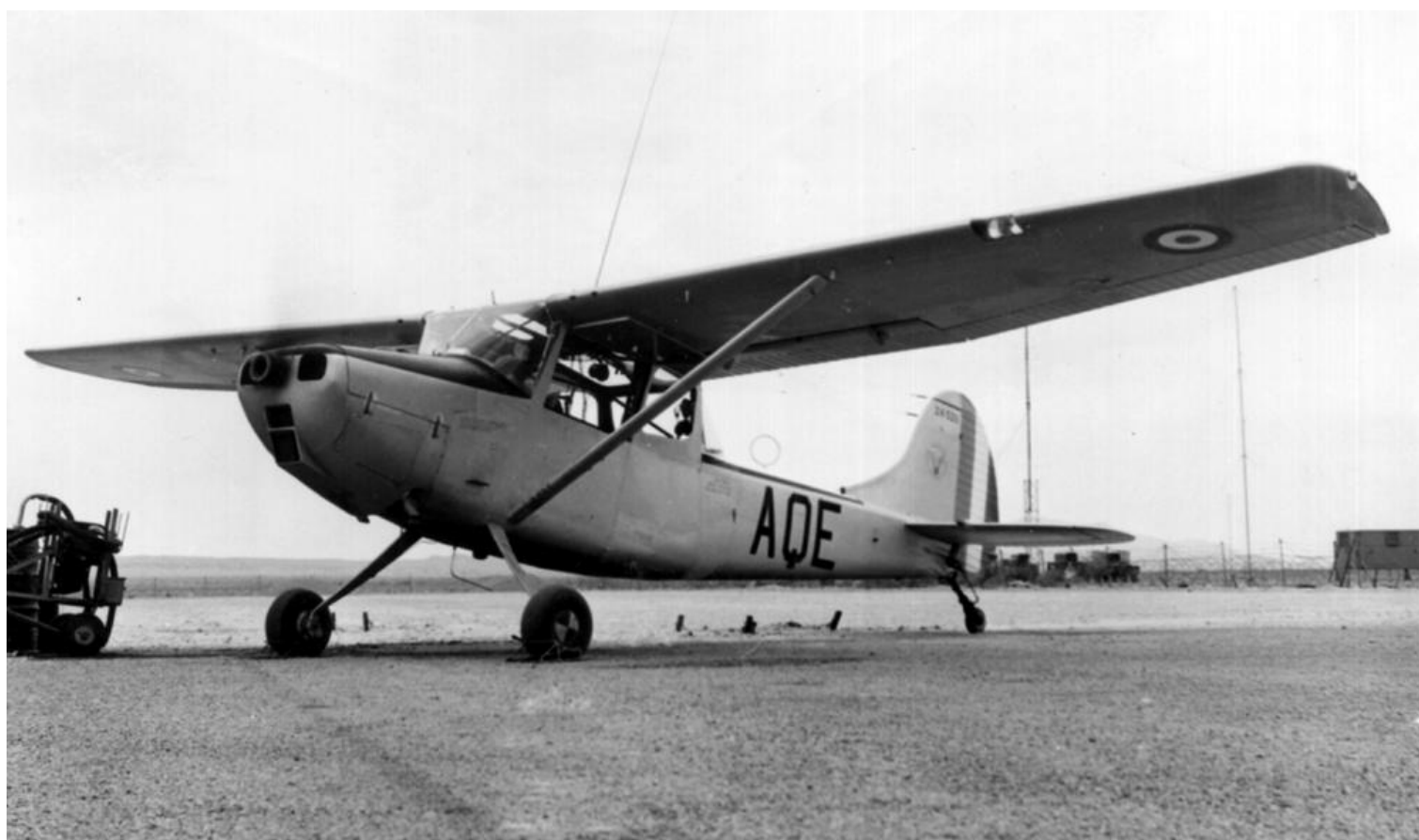
En 1960, L-19E n° 24525/AQE du GALAT N°3, de passage à Colomb-Béchar.