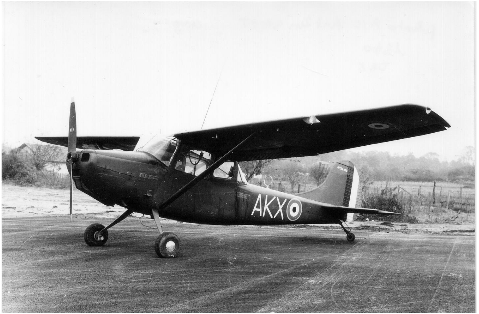
Cessna L-19E 24512/AKX de l'ES.ALAT à Dax.