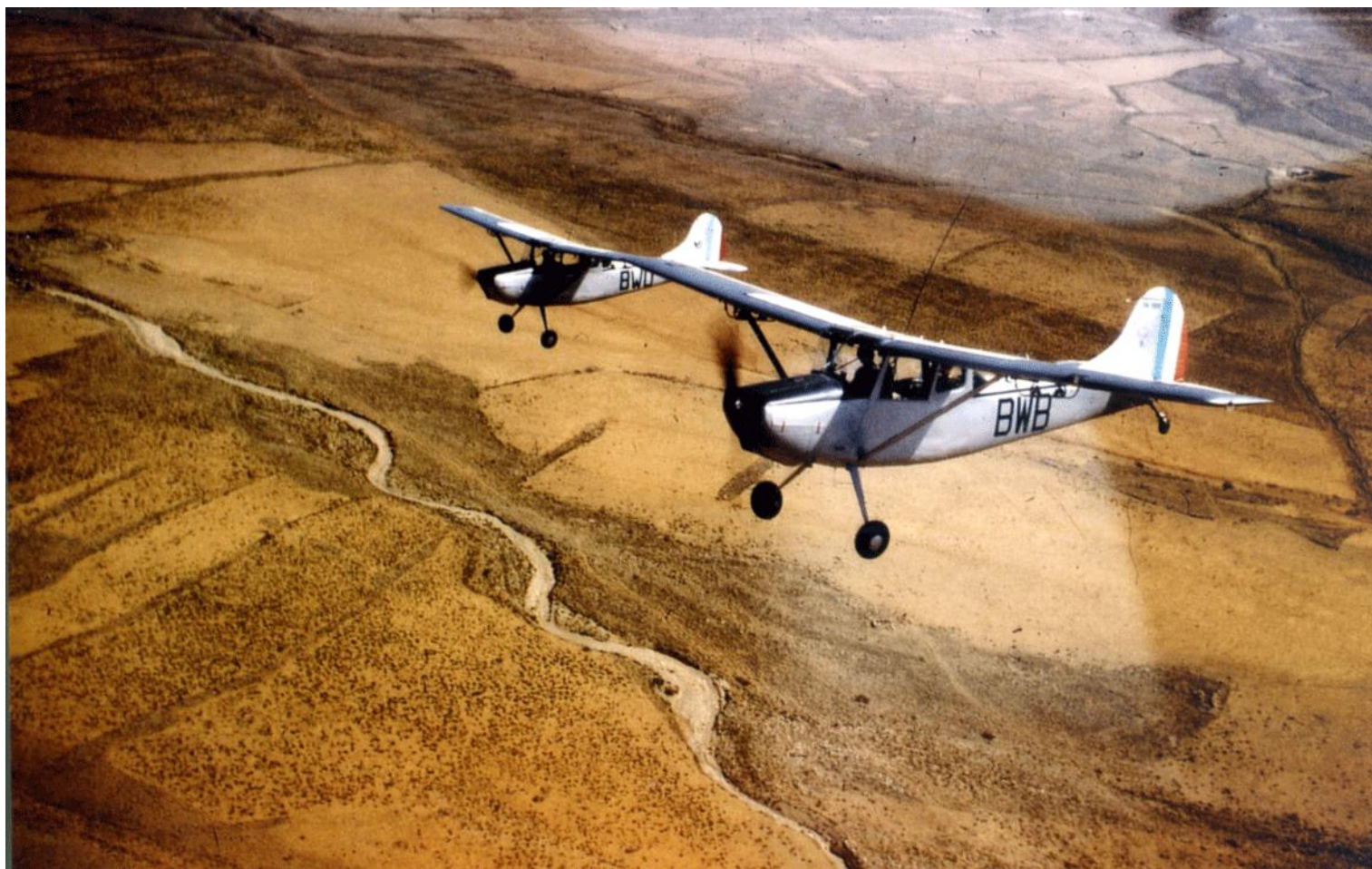
L-19 BWD et BWB du 2 e PMAH/RG, en octobre 1961, dans la région de Bou-Hamama dans les Aurès.