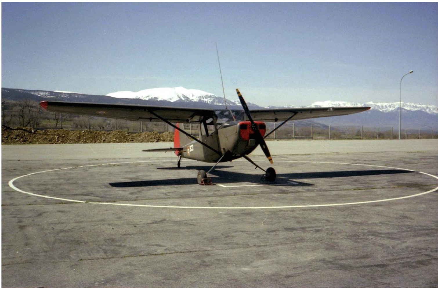
L-19E n° 24517/BCD de l'ES.ALAT, au printemps 1978 à Sainte-Léocadie.