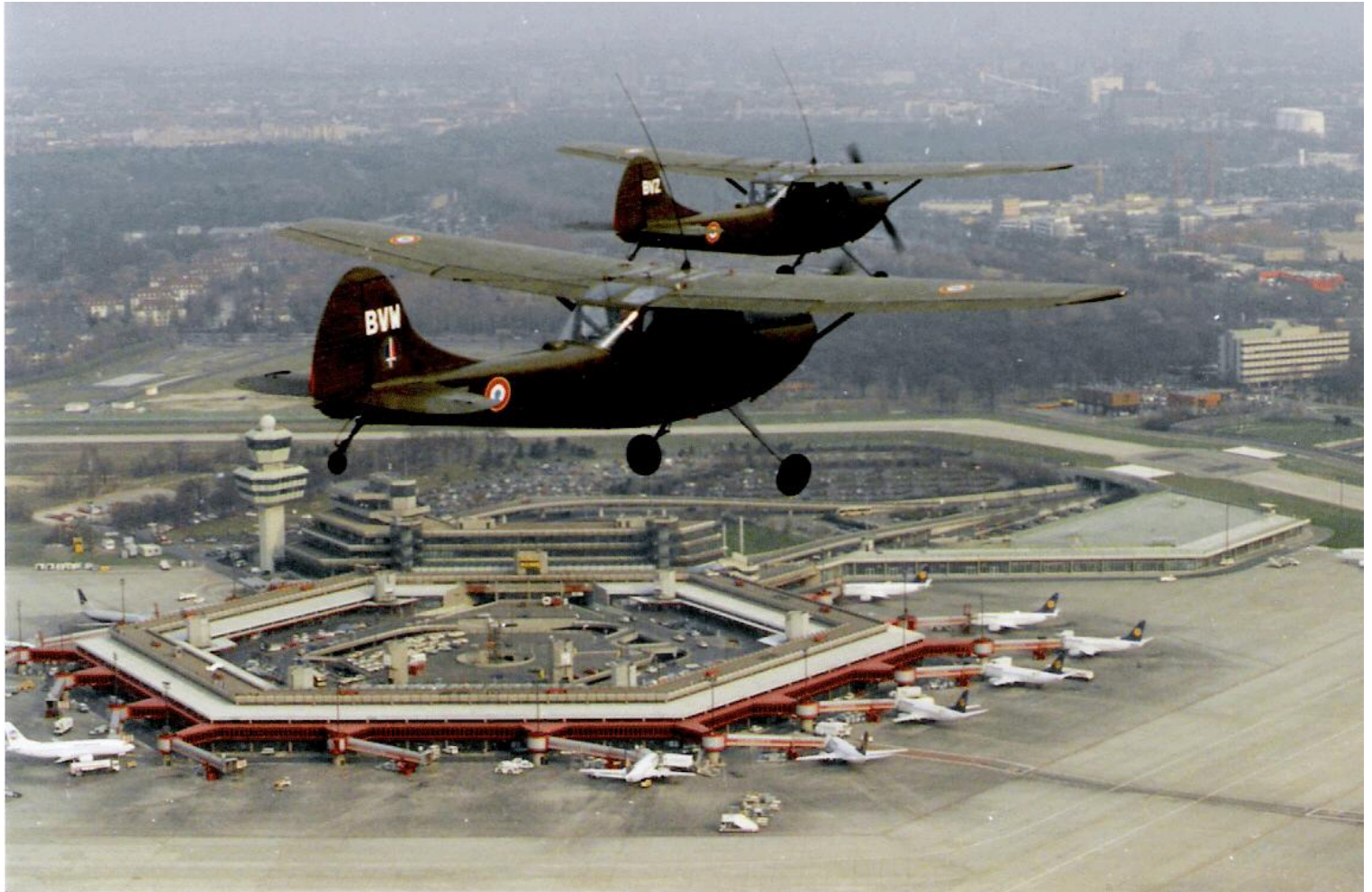
Survol de l'aéroport de Berlin-Tegel par les L-19E du Detalat de Berlin.