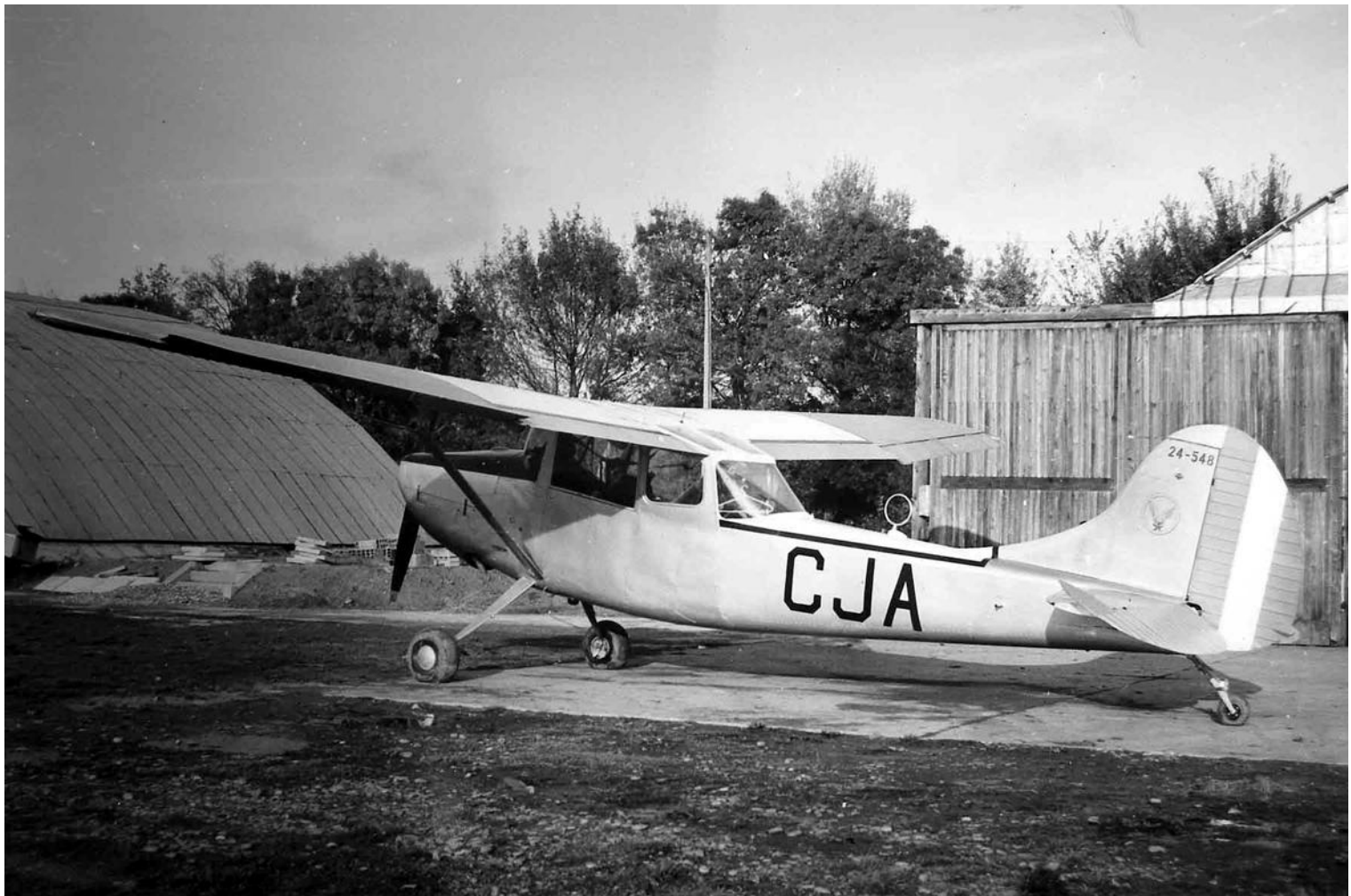
L-19E n°24548/CJA, du GALAT 104 à Toulouse-Lasbordes entre 1962 et 1965.