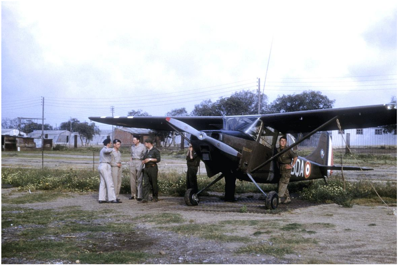
L-19E n° 24546/BQA du PA de la 27 e DIA, à La Réghaïa en 1958. Ci-dessous, détail du dessin peint sur la dérive fixe.