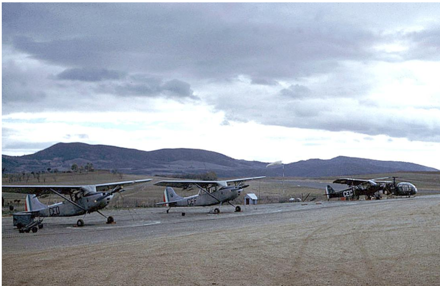
Au premier plan, L19 CED et CEF du 2 e PA de la 2 e DIM, au parking à Souk-Ahras.