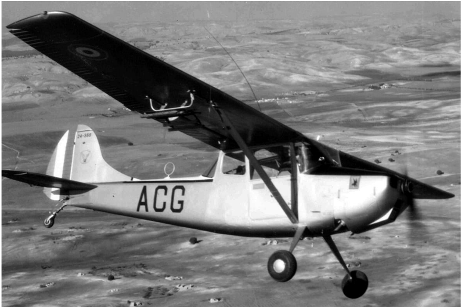
L-19E n° 24558/ACG du PMAH de la 10 e DP équipé de roquettes fumigènes.