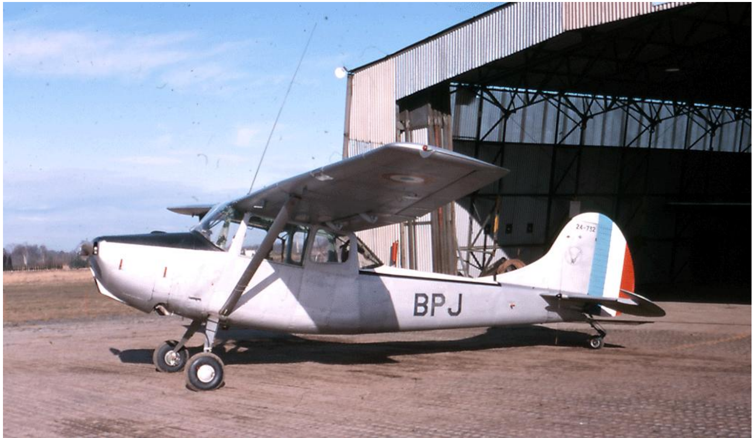
L-19E n° 24732/BPJ, du Galdiv 11, à Pau en janvier 1966.