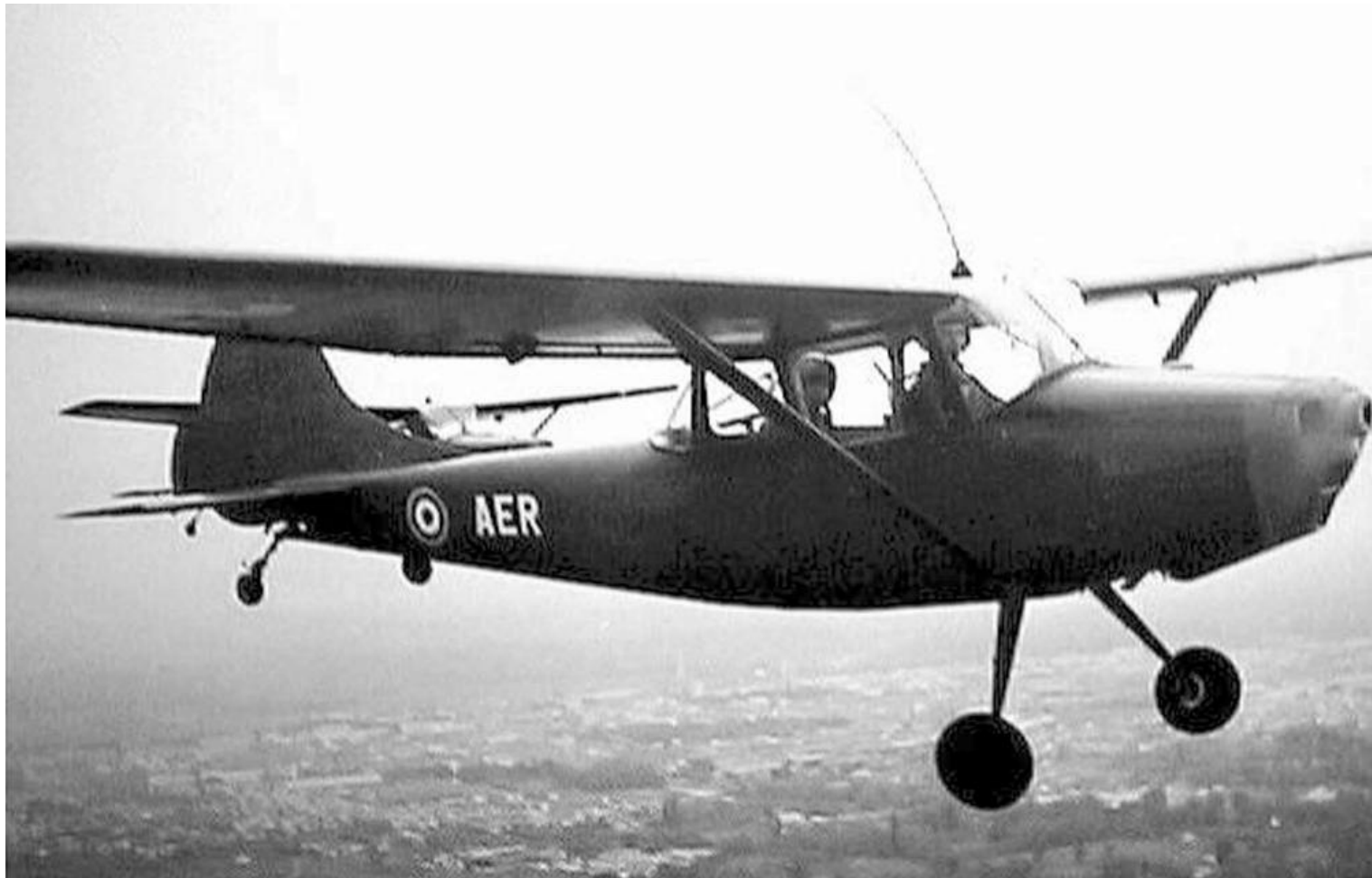
GALAT N°5 de Tarbes, le 14 juillet 1966. L-19E, codé AER, avec, à son bord, Tikoutoff et Campourcy.