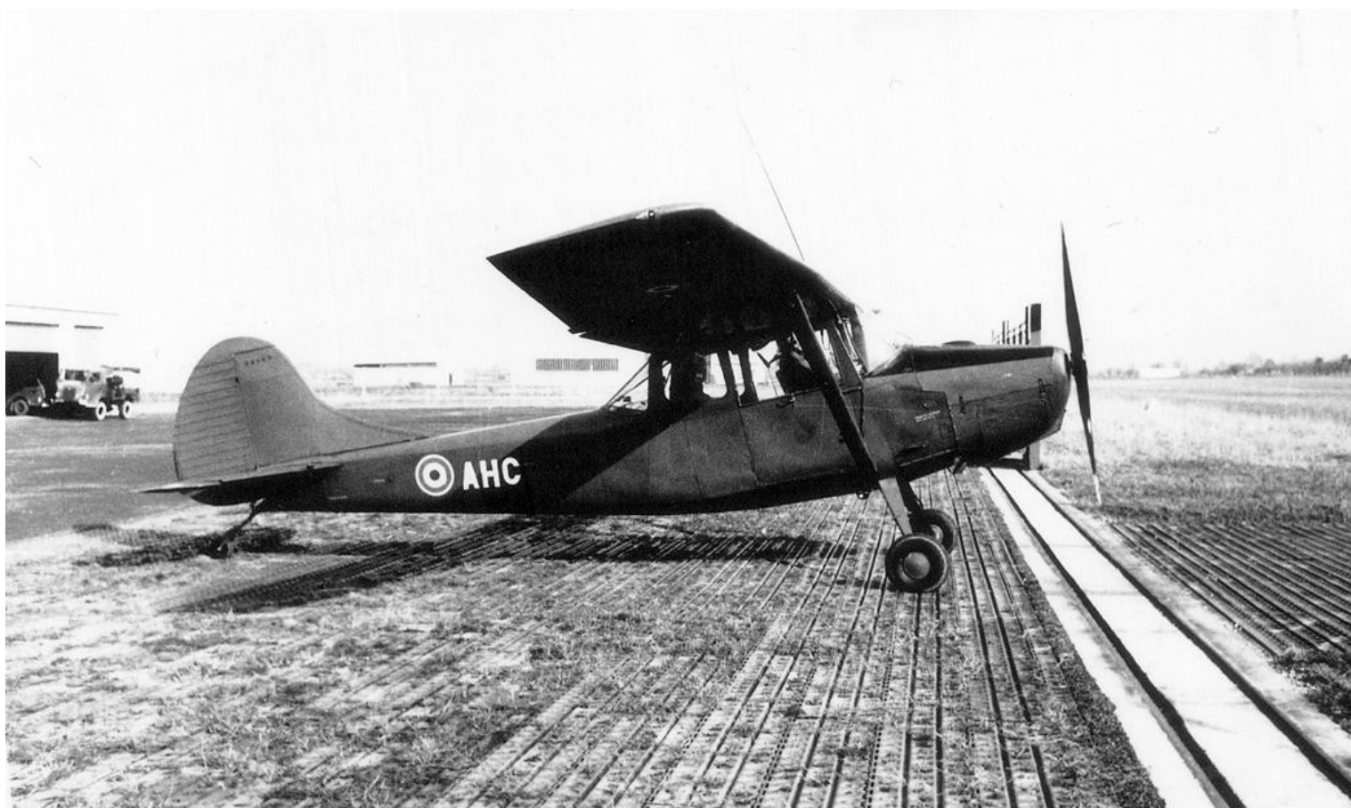
L-19E, codé AHC, du 5 e GALAT, en 1969 à Corbas.