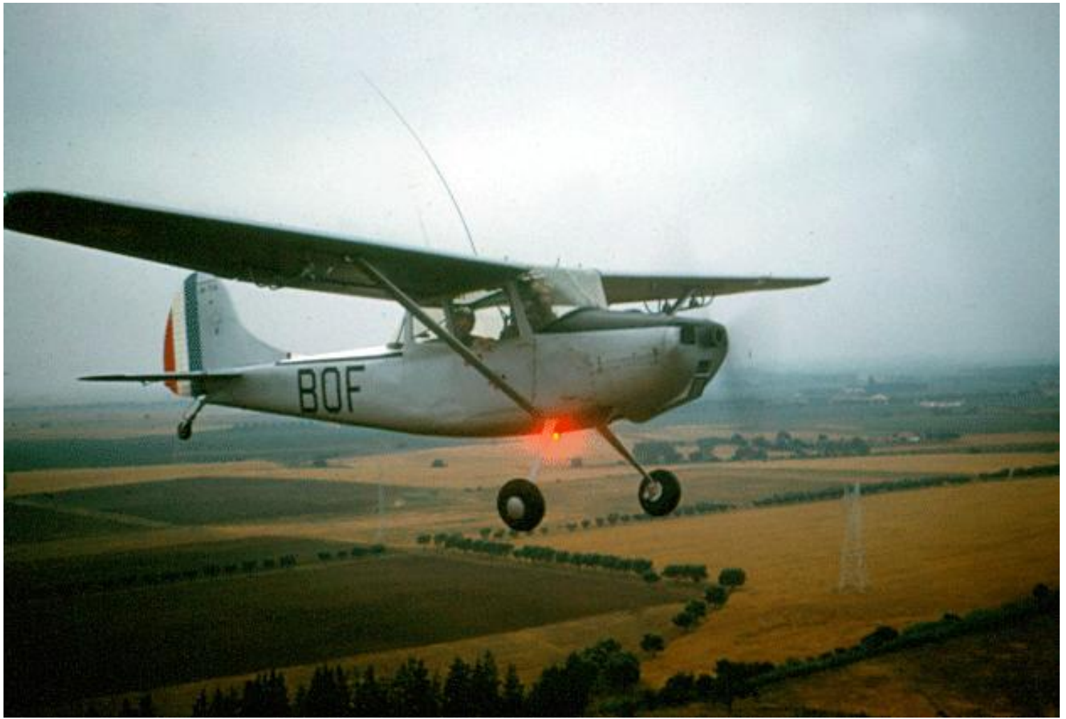
L-19E n° 24714/BQF du PMAH de la 27 e DIA.