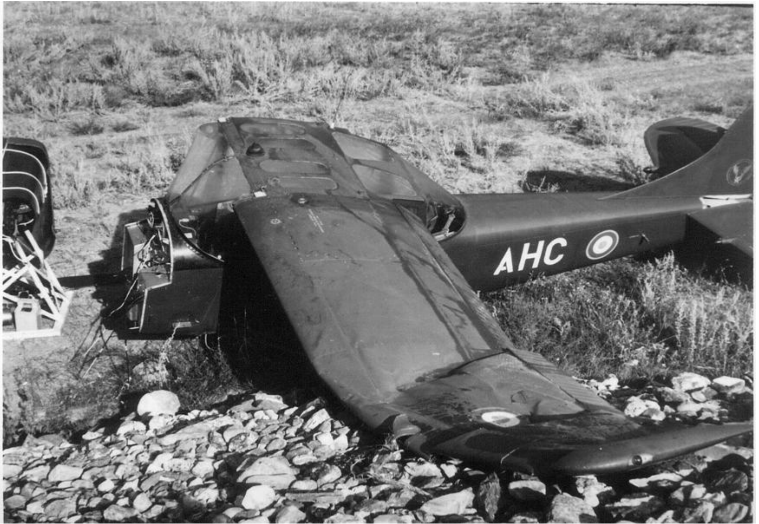
Cessna L-19E n° 24733/AHC du GALAT N°9 de Valence, crashé en 1962 sur le terrain de Sollières près du col du Mont-Cenis.