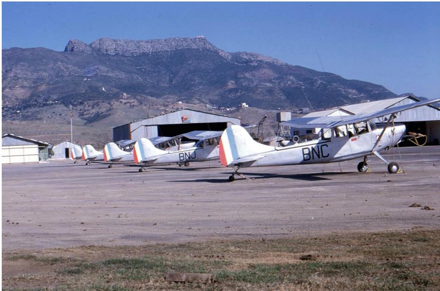
Bougie, en novembre 1962. Au premier plan, le L-19E n° 24537/BNC du PMAH de la 19° DI.