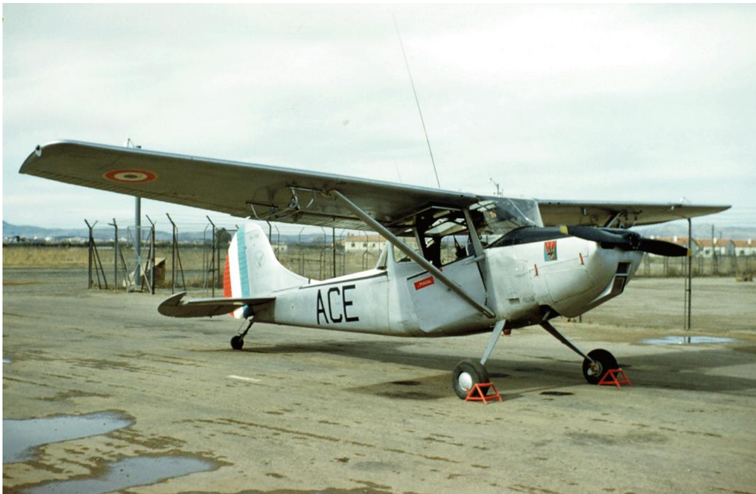
L-19E n° 24702/ACE du PMAH de la 10 e DP. L'insigne de la 10 e DP figure sur le capot moteur.