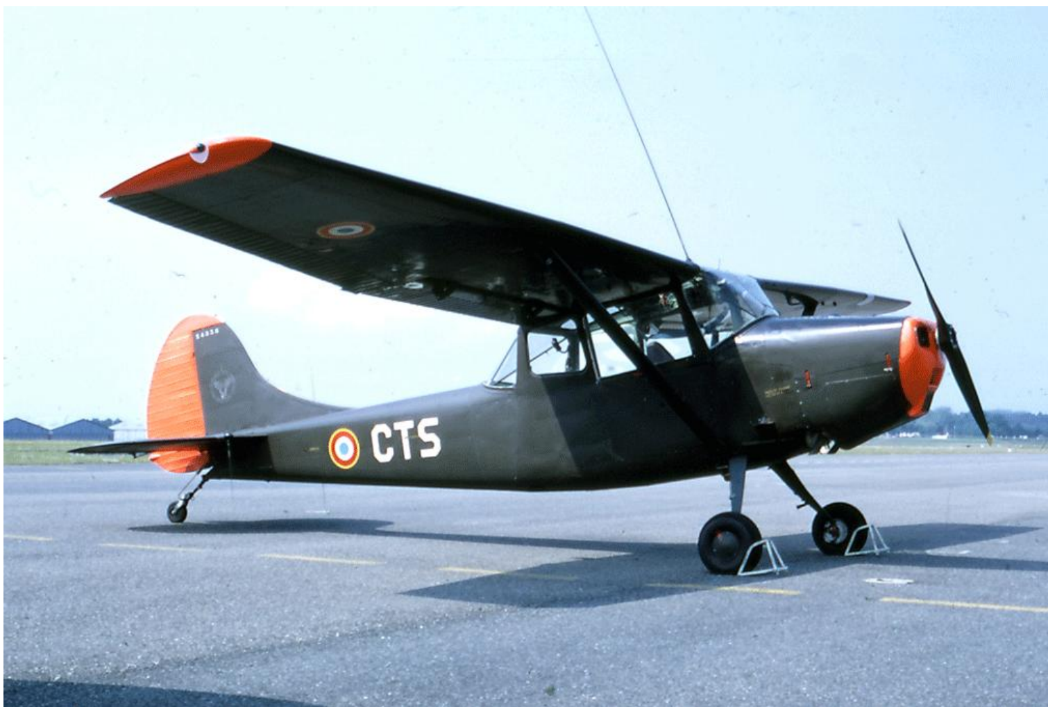
ES.ALAT, Dax, juin 1967, L-19E n° 24538/CTS.