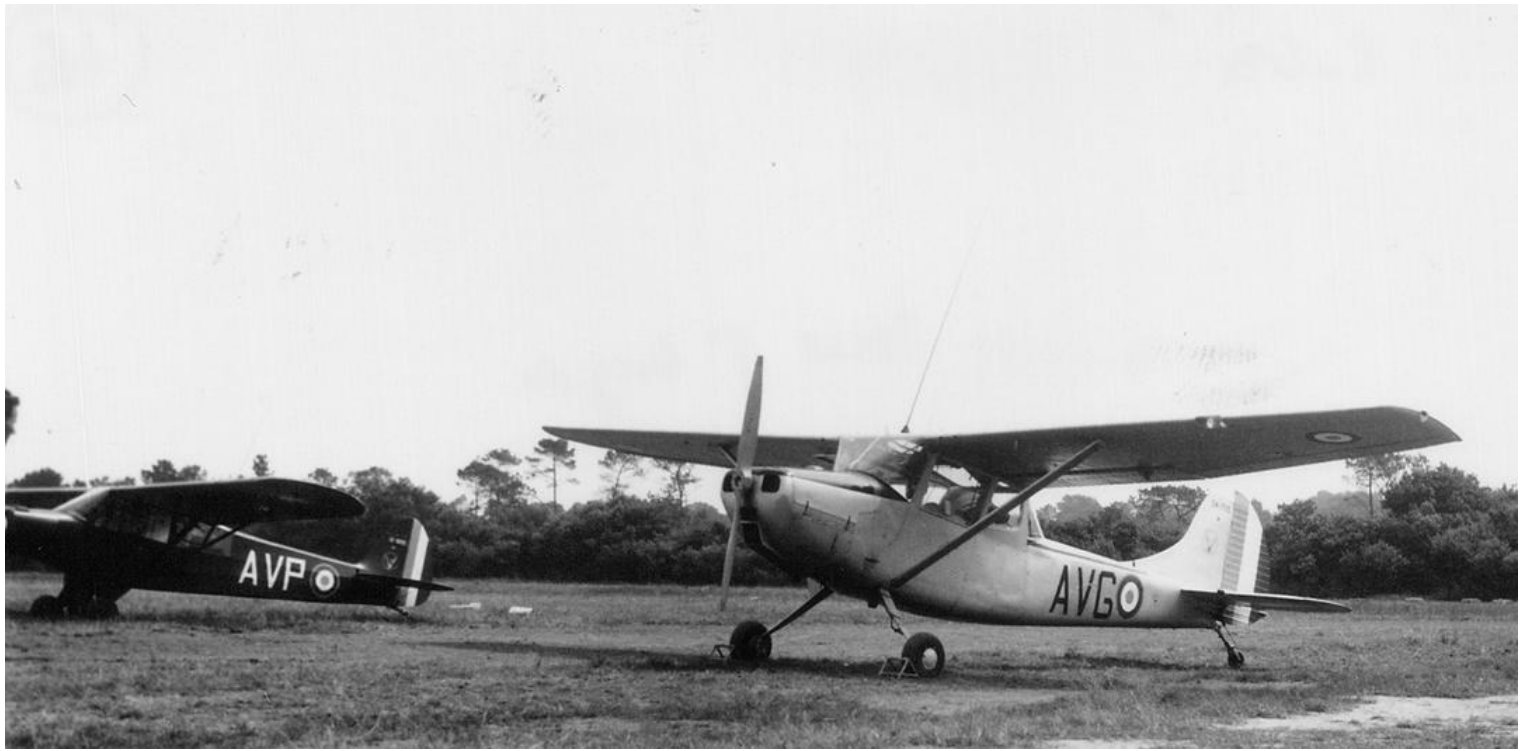
Cessna L-19E codé AVG, du Galdiv 9, en août 1963, à Scaer.