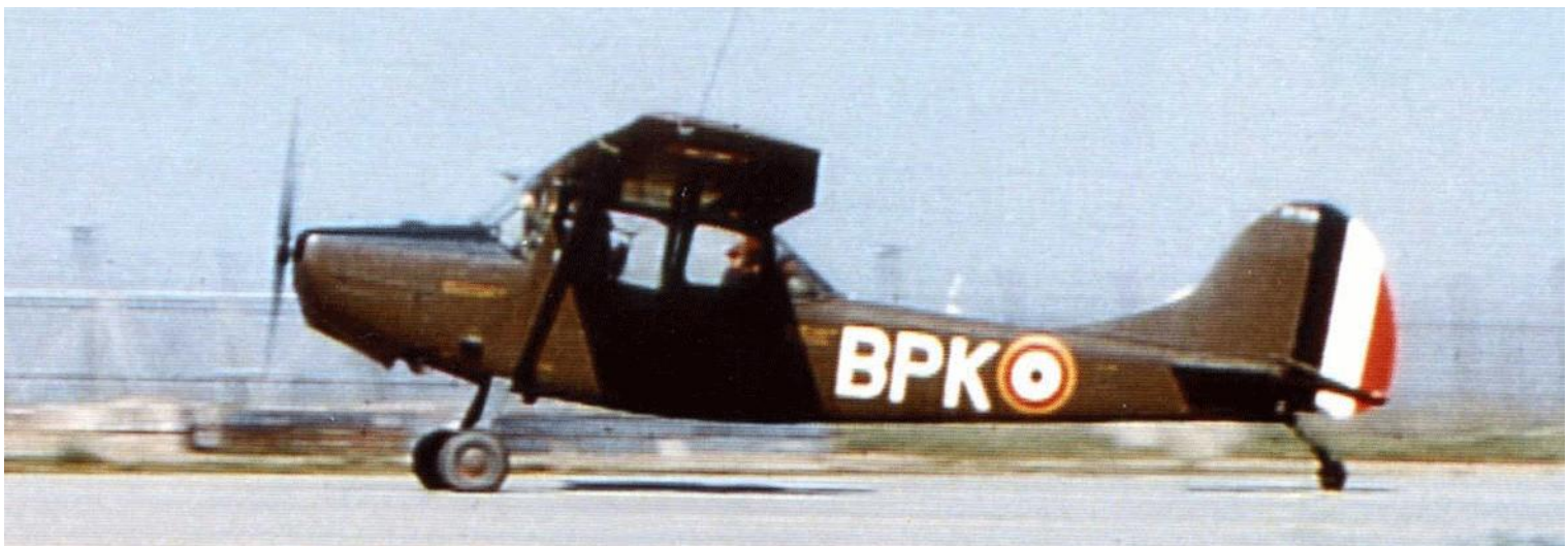
L-19E, codé BPK, du PMAH de la 25 e DP.