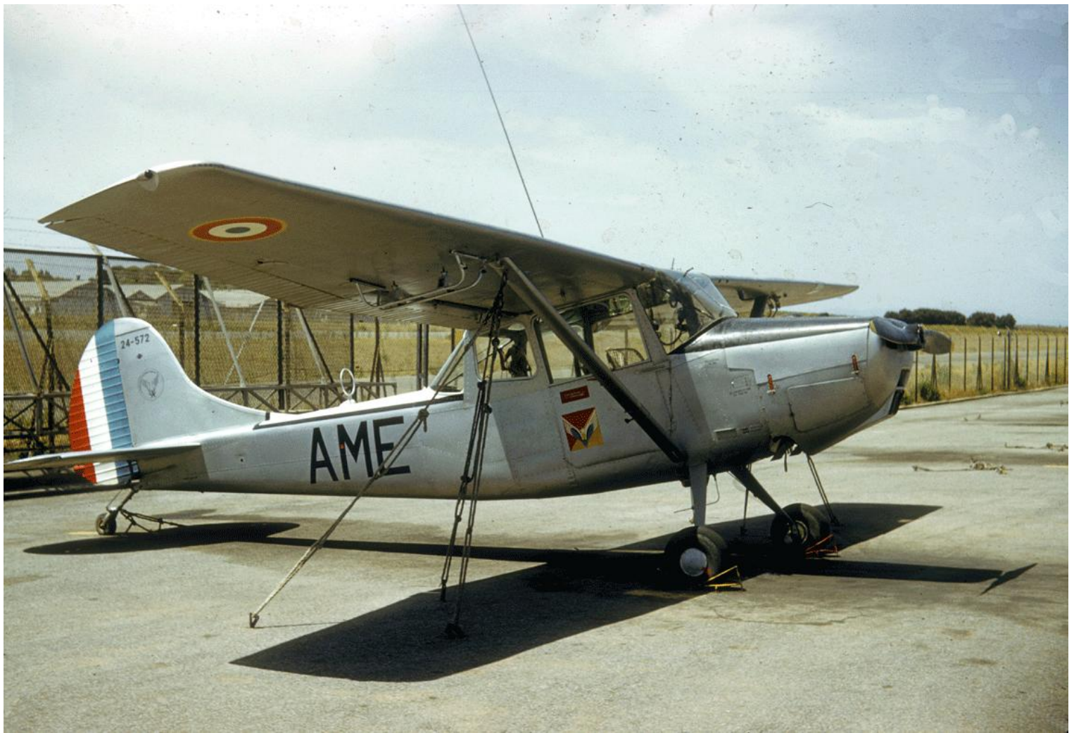
L-19E n° 24572/AME, du 2 e PARR, en juillet 1962 à Chéragas. Sur la portière, l'insigne du 2 e PARR.