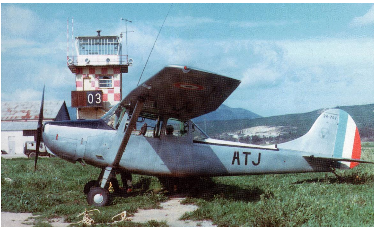
L-19E n° 24702/ATJ du 9 e GALAT.