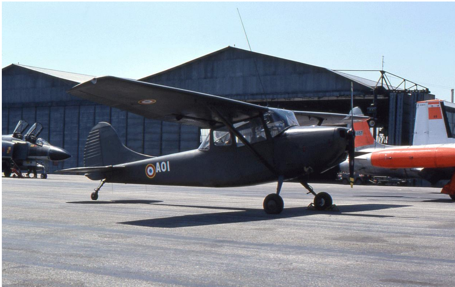
Lors d'une JPO à Dijon, en juillet 1977. Cessna L-19E n° 24524/AOI, du 6 e GALREG.