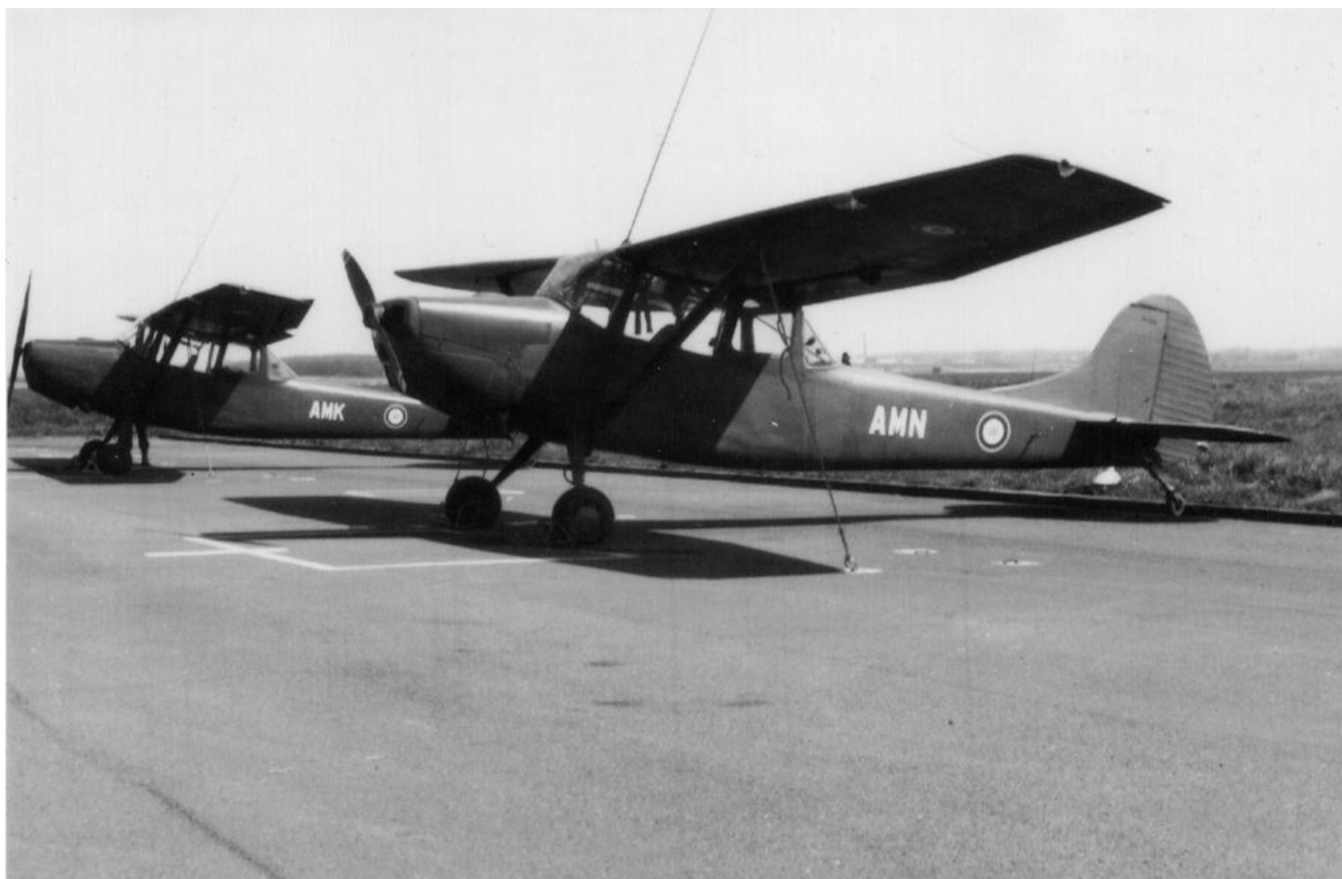
L-19E codés AMN et AMK à Lille-Lesquin. du 2 e GALREG.