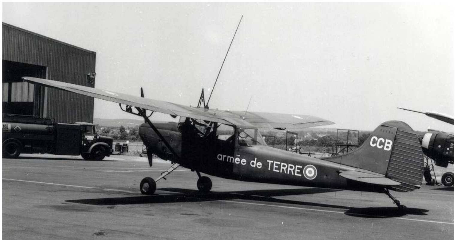
L-19E n° 24534/CCB de l'EALAT.EAI, en 1985 à Aix.