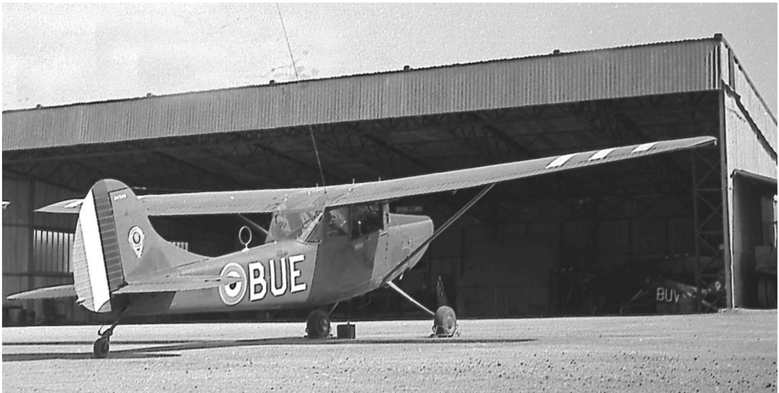
L-19E, codé BUE, du PMAH de la 21 e DI, en septembre 1959. L'insigne de la division est porté sur la dérive fixe.