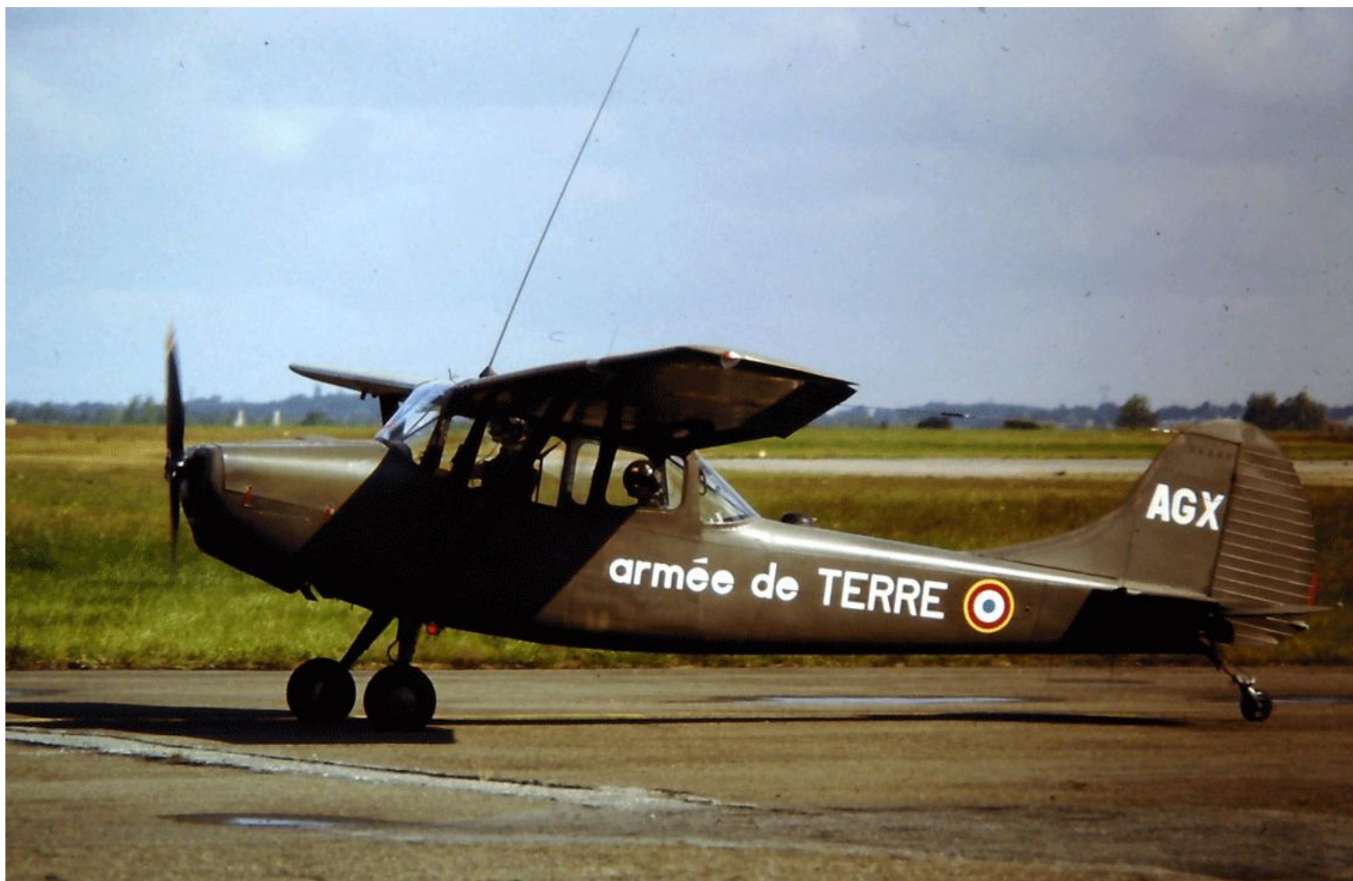
L-19E n° 24582/AGX, du 3 e GALREG..