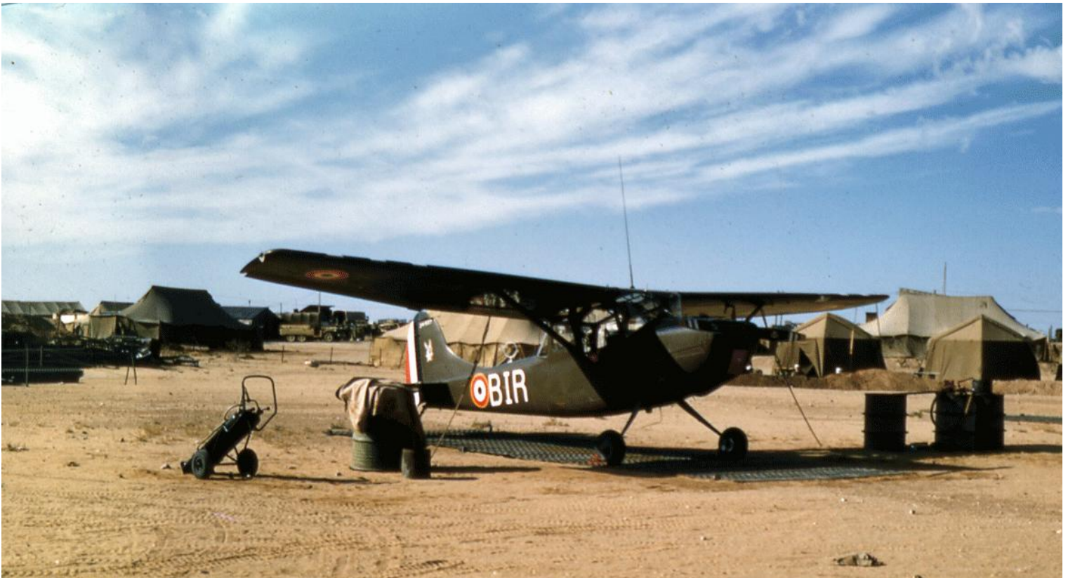
L-19E codé BIR, du 2 e PA de la 2 e DIM, à Bir el Ater.