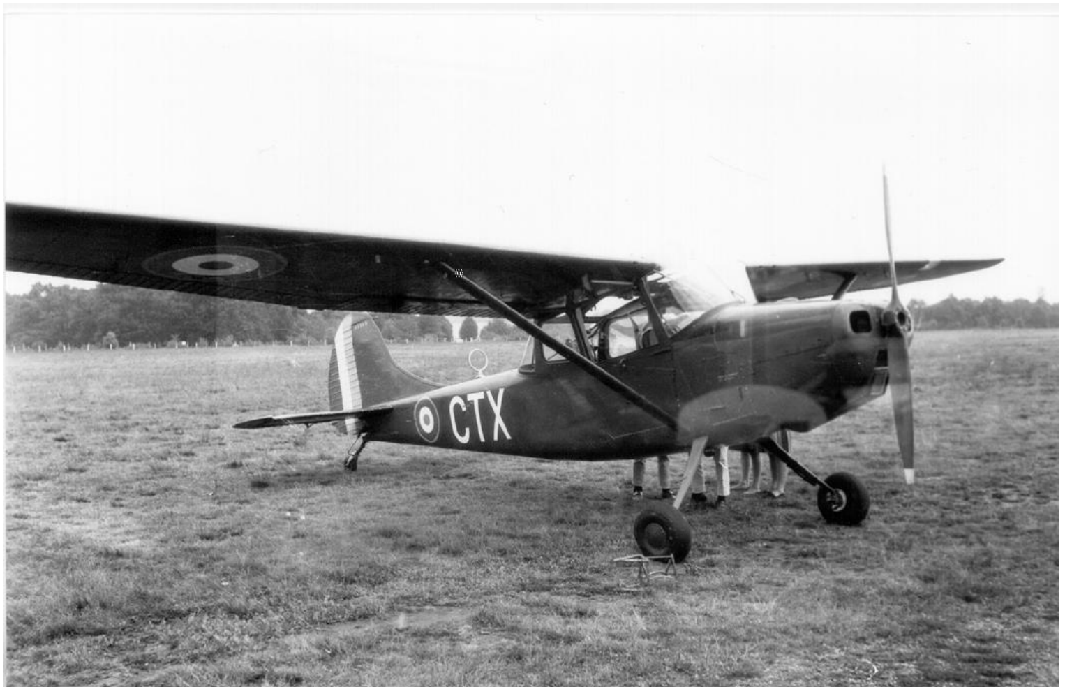
Cessna L-19A n° 23313/CTX, en septembre 1963, en visite à Pau-Idron.