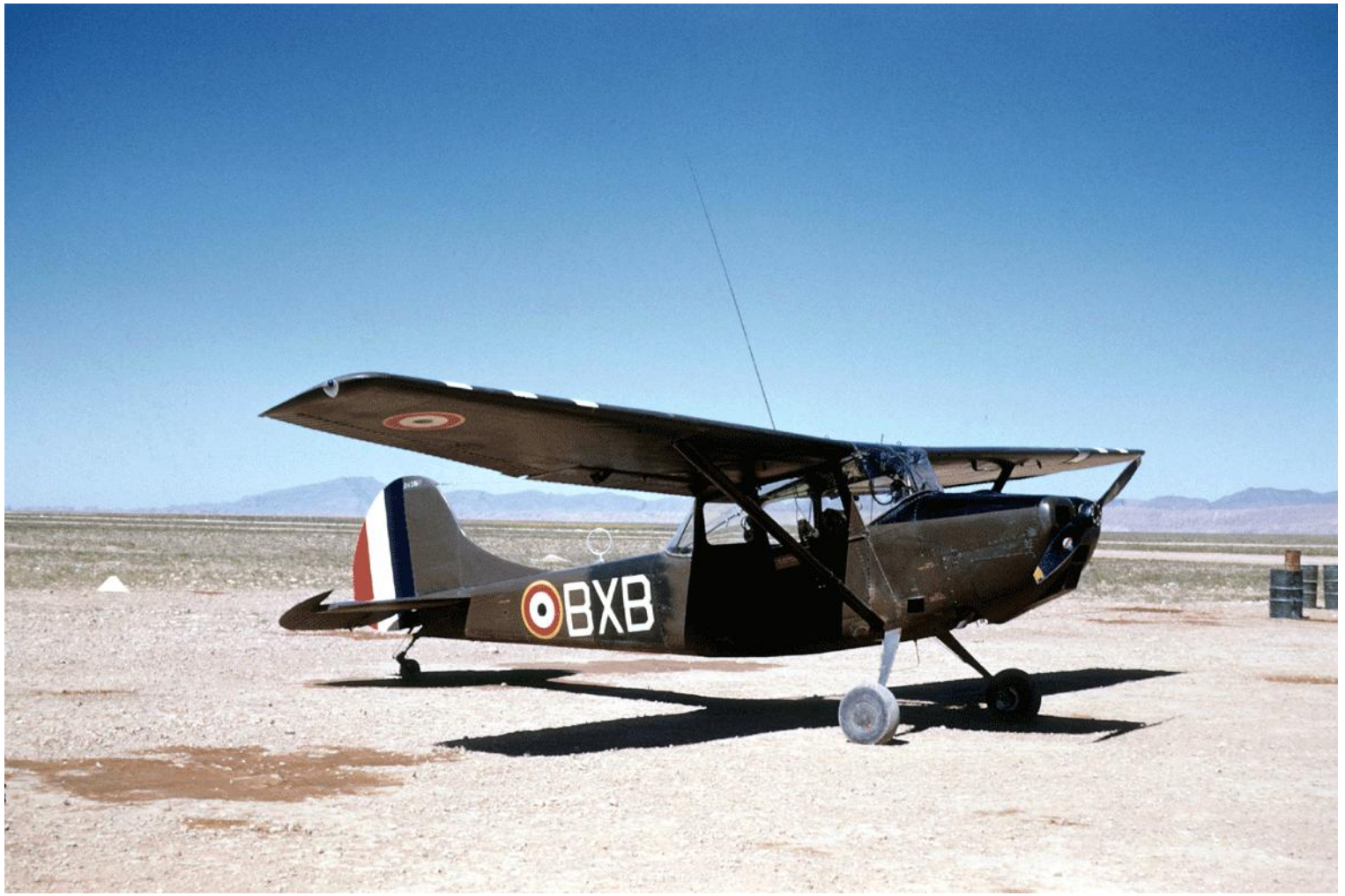
Cessna L-19E n° 24569/BXB du 1 er PA ZOS.