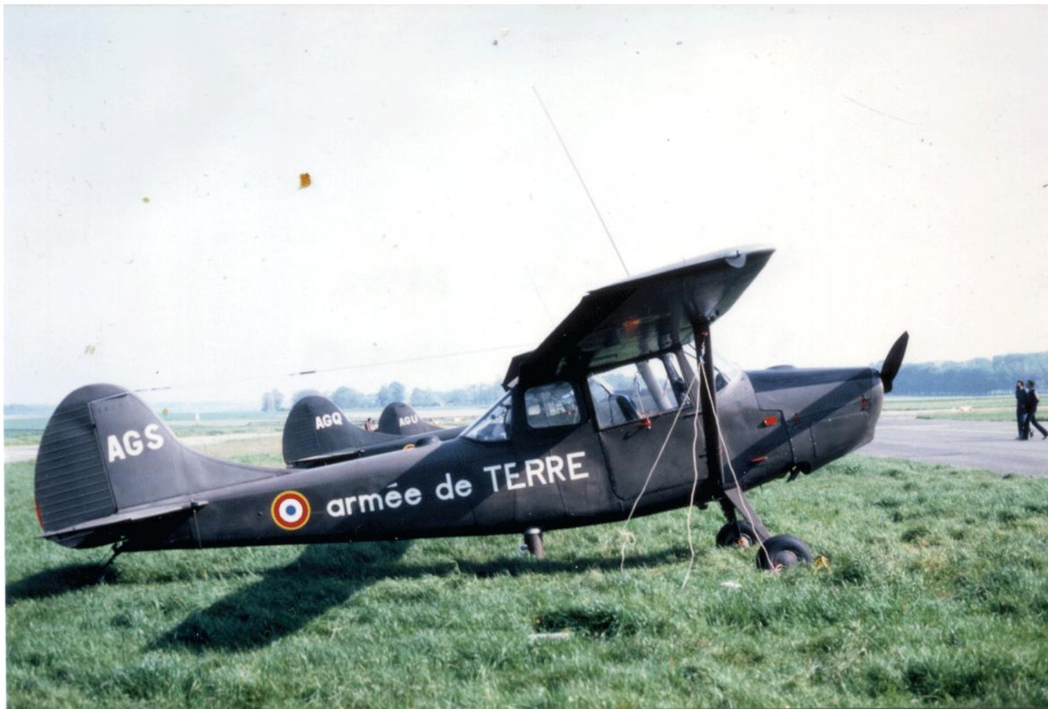
L-19E n° 24502/AGS du 3 e GHL à Saint-Valéry en Caux, le 24 mai 1983.