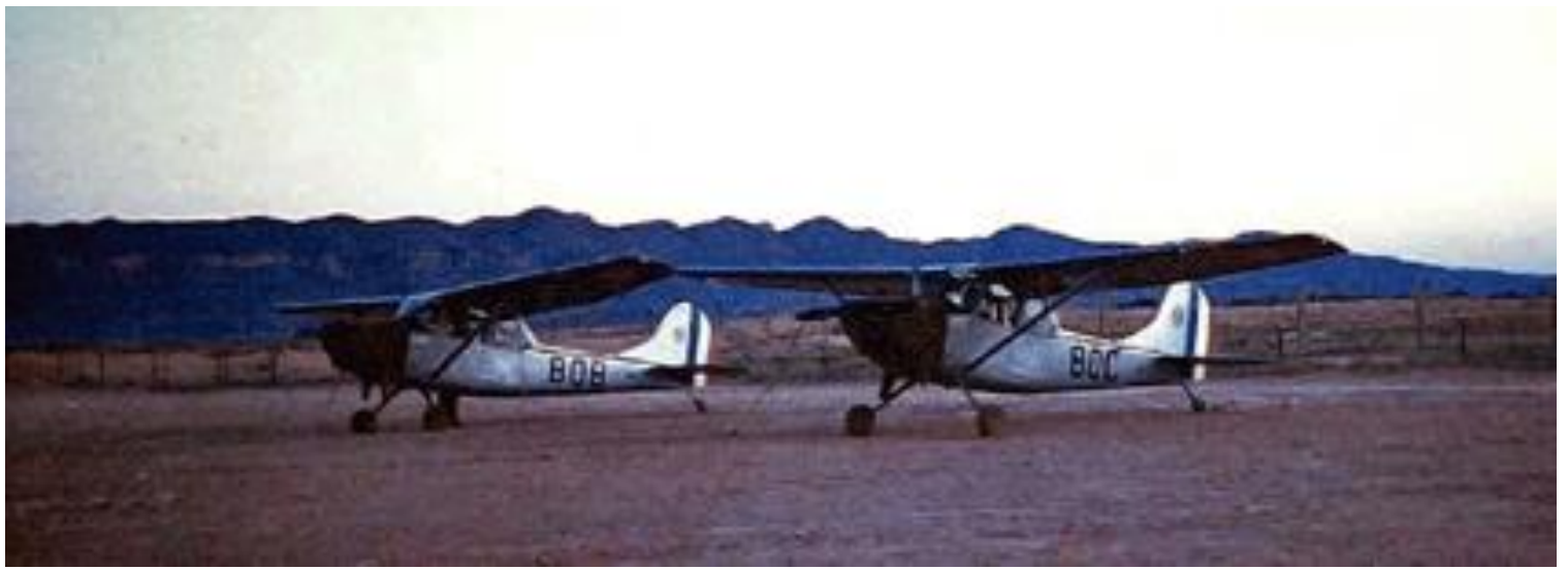
L-19E, codés BOB et BOC, du PA de la 20 e DI, à Bordj du Caïd, en 1959.