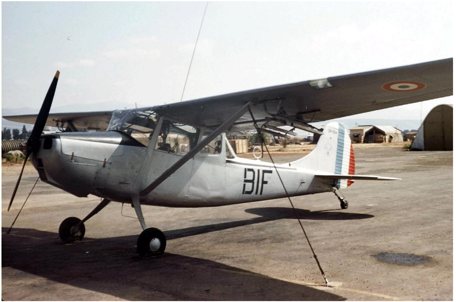
L-19E n° 24584/BIF du 1 er PMAH de la 2 e DIM à Guelma en 1961