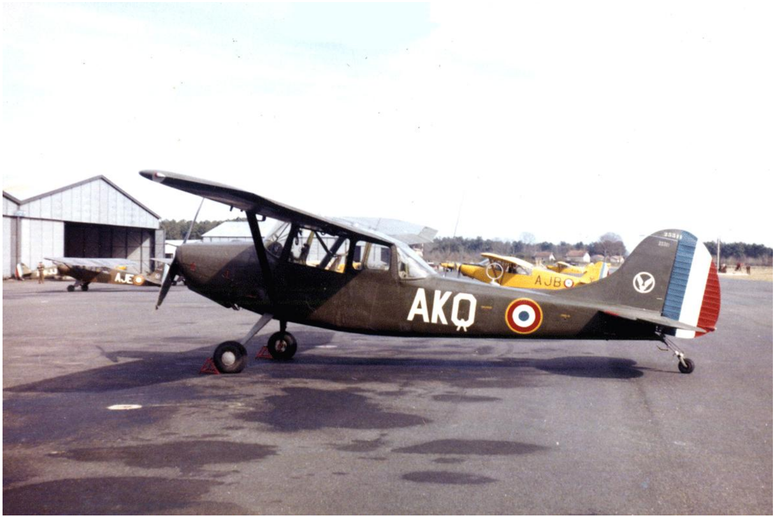
L-19A n°23311/AKQ de l'ES.ALAT à Dax en 1959.