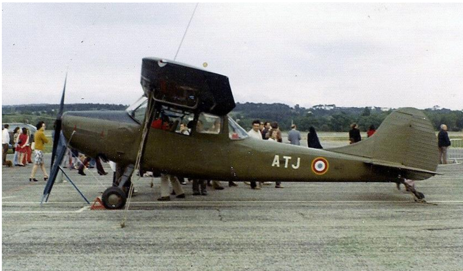
BA 114, Aix-les-Milles, le 20 mai 1973, lors d'une JPO, L-19E n° 24524/ATJ du 7 e GALAT.