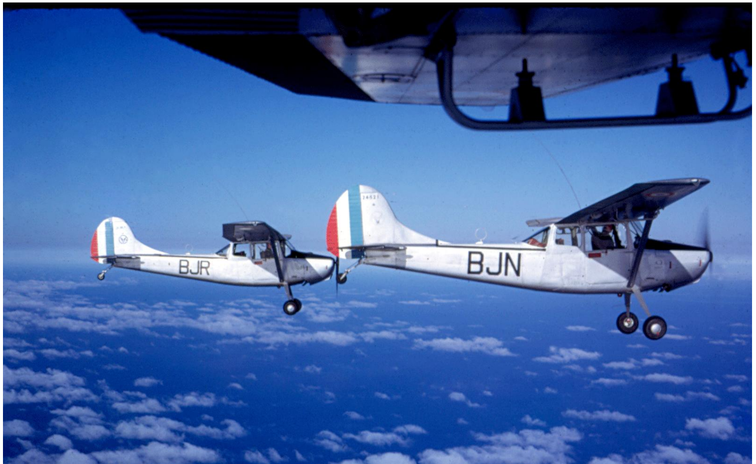
Cessna L-19E n° 24521/BJN et BJR, du 3 e PMAH/RG de retour sur la métropole en juillet 1962 (photo Jean-Yves Grillon).