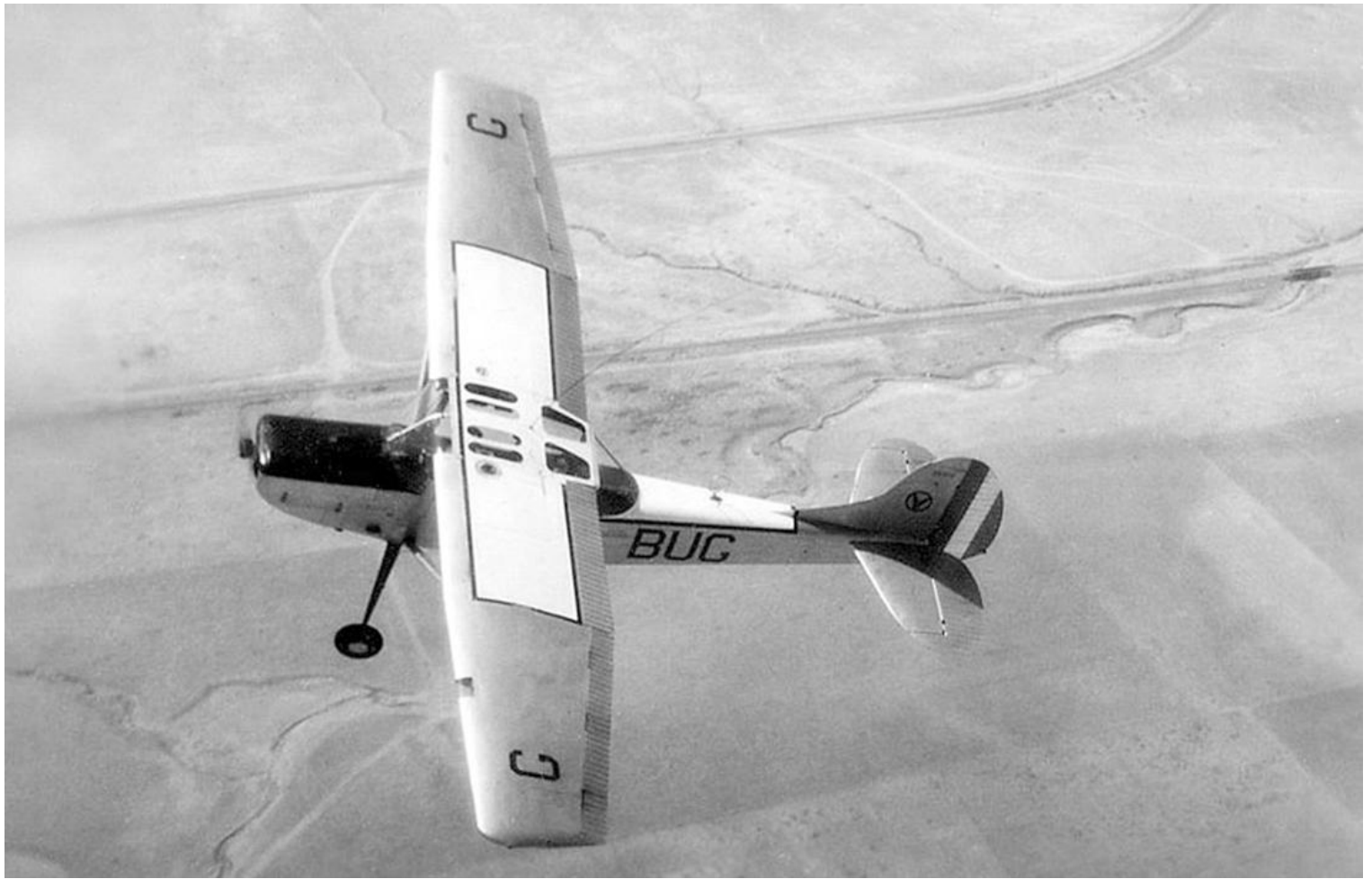
L-19E n° 24577/BUG du PMAH de la 21 e DI en 1960, exposant ses marquages à l'objectif.