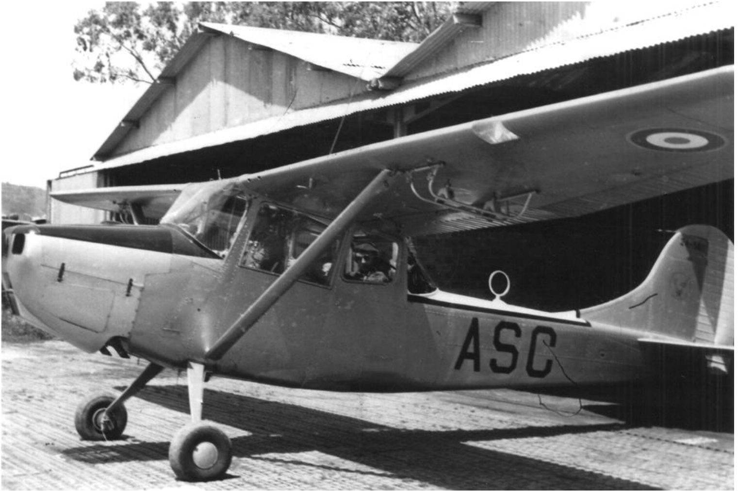
L-19E codé ASC du 1 er PARR à Collo en 1961.