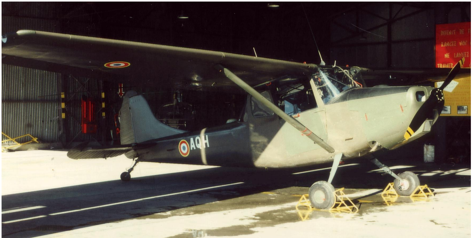
L-19E n° 24572/AQH du 4 e GHL, en janvier 1980.