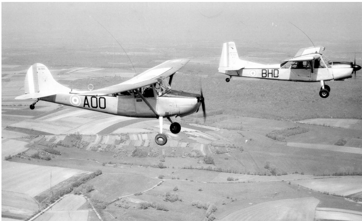
Nancy, 1963, le Cessna L-19E n° 24590/AOO du GALAT N°6, et le Nord 3400 n°112/BHD du CIS.ALAT.