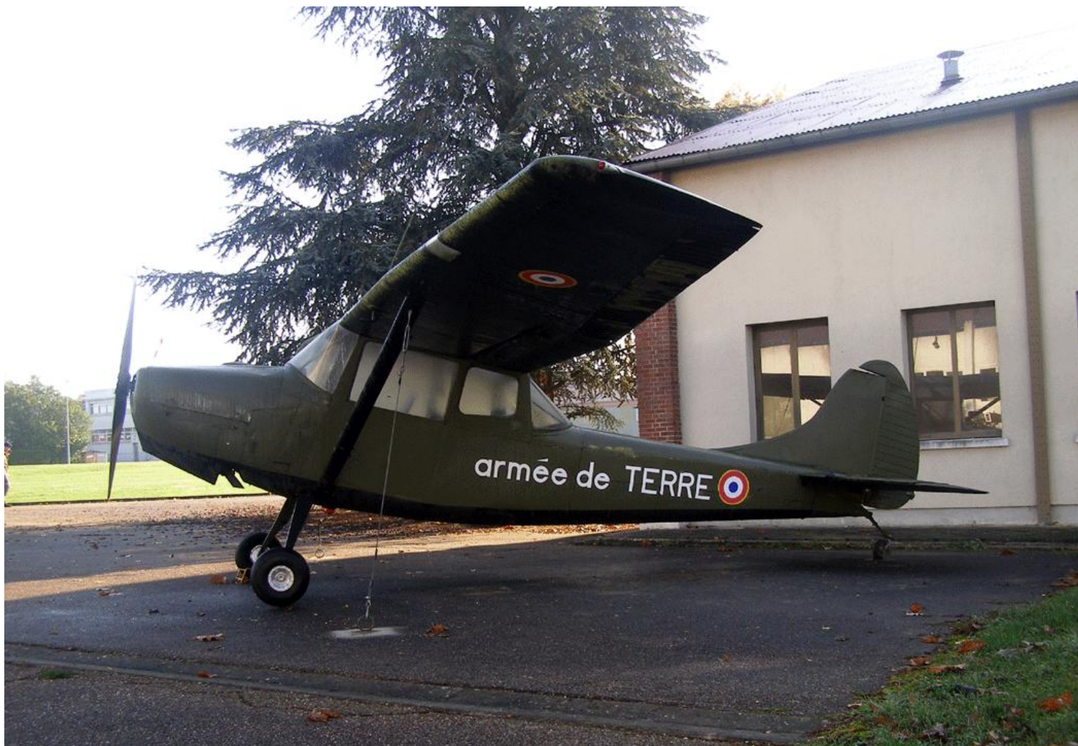
Bourges, novembre 2009, en exposition statique, le Cessna L-19E n° 24523.