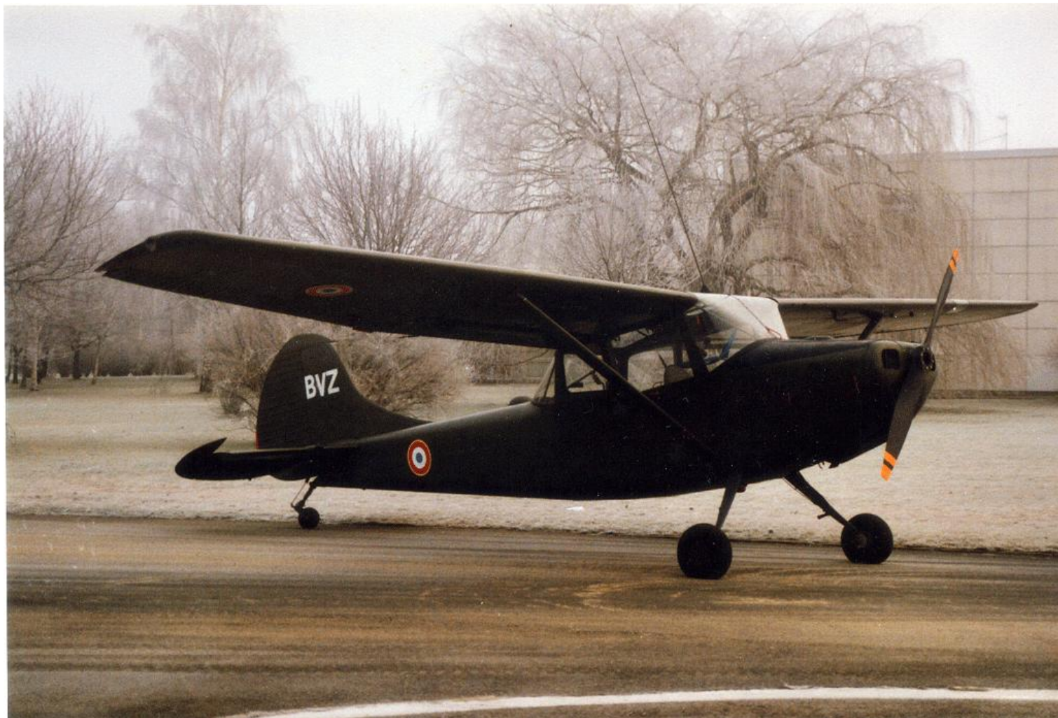
L-19E 24702/BVZ, du Detalat de Berlin, en décembre 1992 à Berlin-Tegel