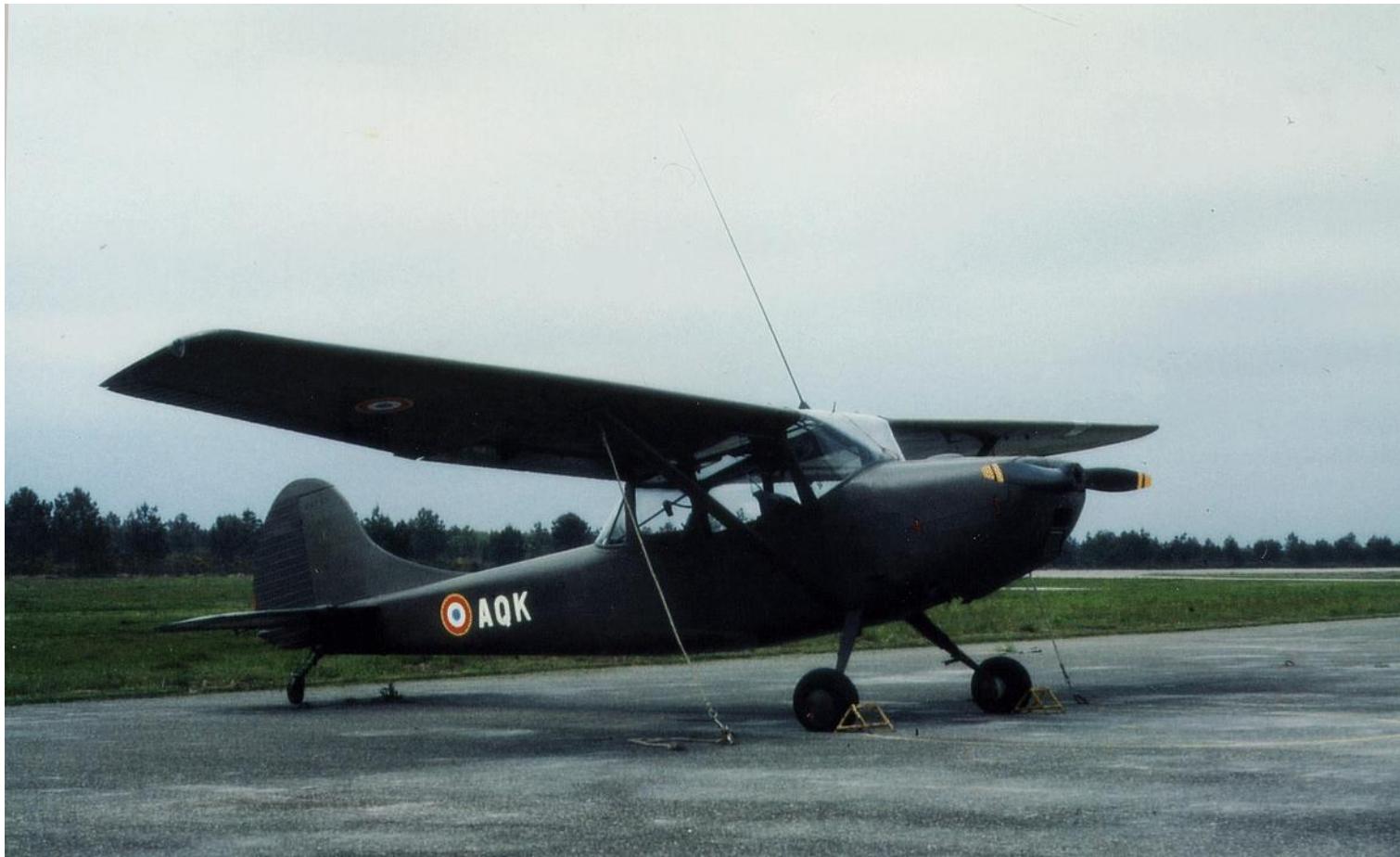
L-19E n° 24725/AOK du 4° GALREG, en mai 1978. (photo X, collection Christian Malcros).