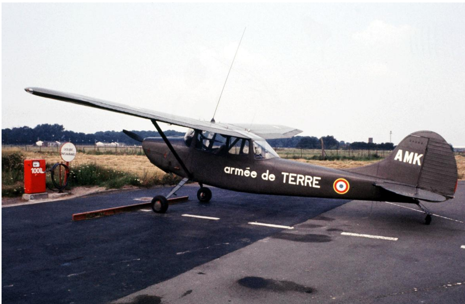
Cessna L-19E n° 24504/AMK, du 2 e GHL à Lesquin en 1981.