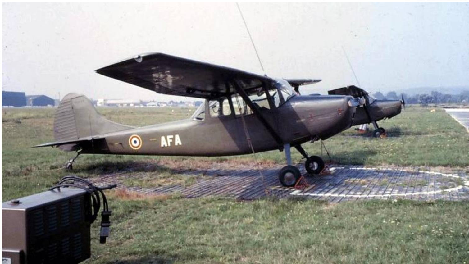
L-19E, codé AFA, du 1 er GALAT aux Mureaux (photo Jean-François Boyard).