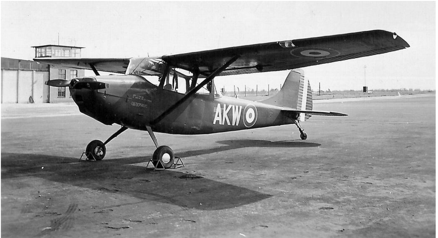
L-19A de l'ES.ALOA à Finthen.