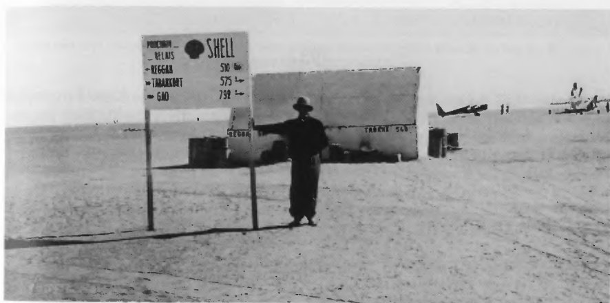
Décembre 1934, Bidon 5 et la balise métallique blanche.