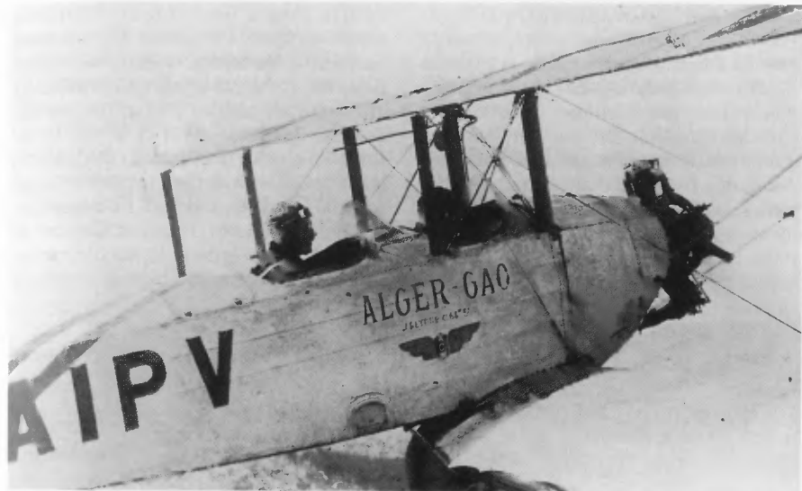
Le « Caudron 161 - F-AIPV » du voyage Alger-Gao du 9 janvier 1930.

tue en famille avec son épouse et son fils, inaugure l'ère du tourisme aérien au Sahara.