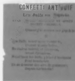
Confettis anti-juifs (2) .