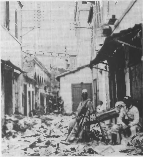
Emeutes de Constantine 5 août 1934.

est lancée. Un groupe de résistants, dont des juifs, organise et prépare le débarquement du 8 novembre 1942 sous l'autorité d'Henri d'Astier de la Vigerie. C'est une réussite. Le général de Gaulle arrive à Alger le 30 mars 1943. Par communiqué du Comité Français de Libération Nationale ( CFLN ), le décret Crémieux est rétabli le 20 octobre 1943. (2b)