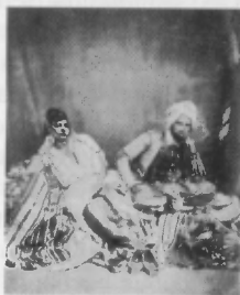
Couple juif d'Algérie.

d'une judaïsation massive alors que d'autres la récuse ( H.Z. Hirschberg ), dénonçant des hypothèses fragiles. (5) On a face à face deux mouvements complémentaires : « des Berbères qui se judaïsaient et des juifs qui se berbérissent... Le judaïsme algérien s'est trouvé, dès son origine, à la fois spécifié par sa vieille option pharisienne et associé étroitement aux destinées des populations indigènes ». (6)