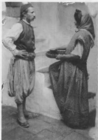
Types juifs algériens.