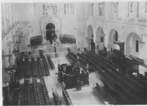
Synagogue d'Oran - extérieur et intérieur.