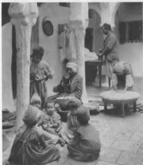
Intérieur d'une maison juive.

Mais ces règles ont été appliquées de façon plus ou moins rigoureuse selon les époques, les lieux, les souverains, leur clémence ou leur tyrannie. Malgré tout, ils restent l'objet d'humiliations, d'un profond mépris et sont considérés comme inférieurs.