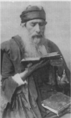
Rabbin lisant la tora.