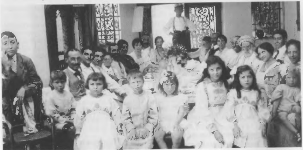
Réunion d'une famille juive, à la villa de l'Hermitage - Alger 1910 . (4)

On peut dire que la présence des Juifs est attestée dès le Ve et VIe siècle en Egypte puis en Libye et au Maghreb. Bien que les preuves manquent, il apparaît possible que des minorités juives soient représentées dans la Carthage punique (2) . Les sources archéologiques et épigraphiques attestent vers 320 av. J.-C les premières grandes colonies juives sur les côtes d'Afrique du Nord. Après l'invasion de la terre d'Israël, Ptolémée Soter, fondateur de la dynastie des Lagides, déporte 100 000 captifs juifs en Afrique ( Egypte, Cyrénaïque...). En 256 av. J.-C, les Romains s'installent sur les côtes africaines et découvrent que, dans les ports, des colonies judéo-romaines étaient déjà constituées (3) . Dans le cadre de l'Algérie actuelle, dès le 1er siècle apr. J.-C, une présence se confirme dans diverses régions et cités : Constantine, Henchir Fouara, Tebessa,