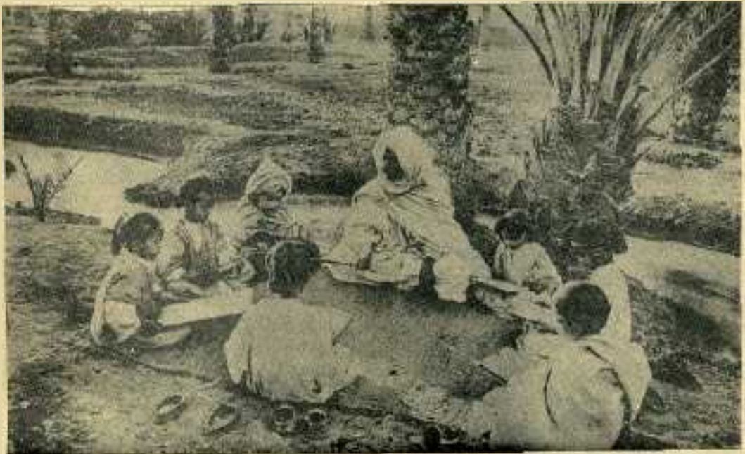
Une petite école coranique à Biskra

Si l'on suppose que tous les habitants de l'Algérie sont également répartis, en divisant la population globale par la superficie totale, on obtient la DENSITE MOYENNE de a3 habitants au km. carré (France 76)- Mais les grandes villes du Tell, et surtout les ports, sont surpeuplées; les régions des Hauts Plateaux et du Sahara sont peu peuplées.