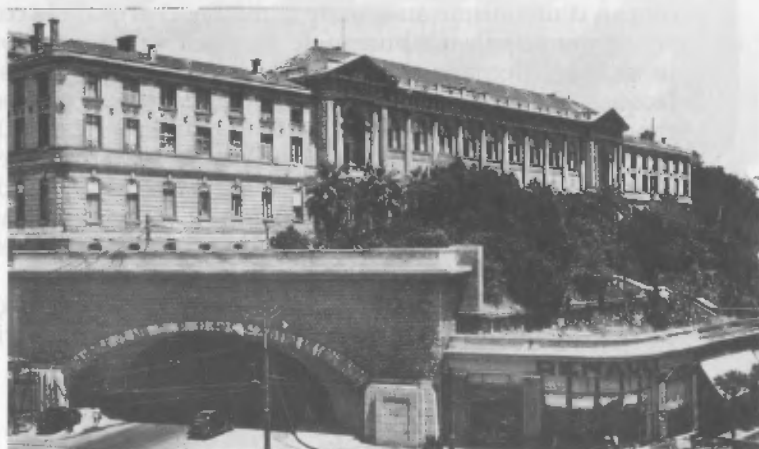
Le « tunnel des facs », in Alger , Teddy Alziéu, éd. Alan Sutton.

En cette année 1952-1953 s'achevait la construction de l'Hôtel du Trésor au quartier de La Marine en cours de reconstruction et s'inaugurait le fameux « tunnel des facs » au cœur de ville. Sans omettre de citer l'imposant ensemble collectif d'appartements du groupe Michelet-Saint-Saëns réalisé