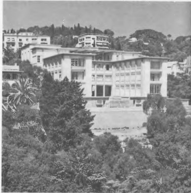
L'école des Beaux-Arts d'Alger, in Les Architectes rapatriés.

elle confiera la réalisation à l'équipe Bize et Ducollet architectes.